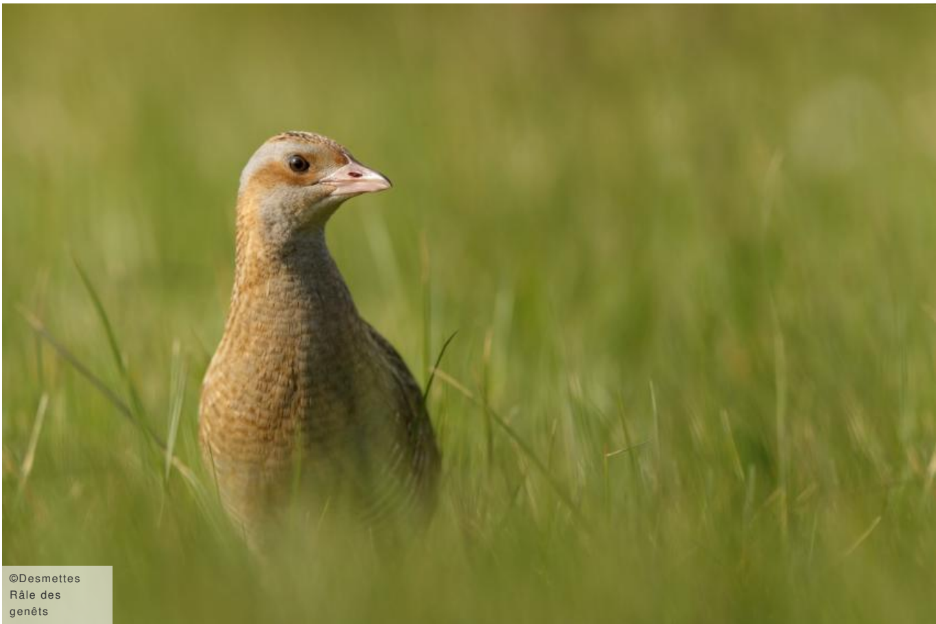
Râle des genêts

Enfin, les bords de la Vienne et de l'Indre sont occupés par des boisements alluviaux ou des peupleraies.