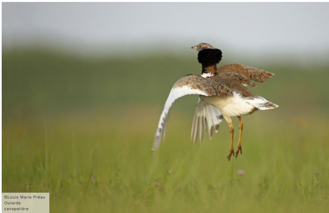
Outarde canepetière

Les prairies, les terres cultivées et les jachères qui se côtoient constituent un milieu ouvert favorable à de nombreuses espèces d'oiseaux protégés par l'Union Européenne : Busard cendré, Outarde canepetière ou Oedicnème criard y trouvent une réserve alimentaire riche et variée et des zones de reproduction. Découvrez la beauté naturelle du Parc naturel régional Loire-Anjou-Touraine en France et profitez des activités en plein air offertes.