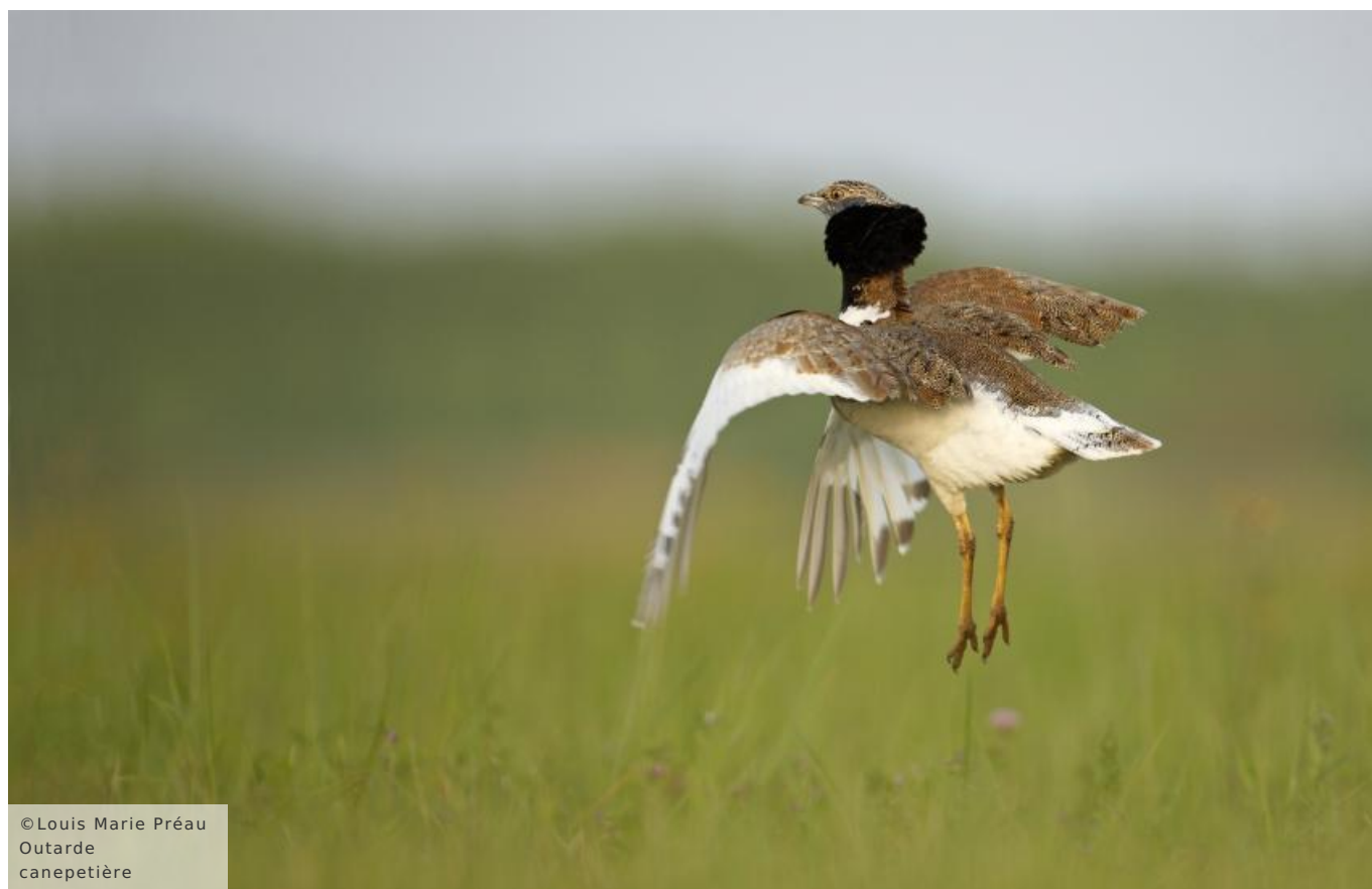
Outarde canepetière

Les prairies, les terres cultivées et les jachères qui se côtoient constituent un milieu ouvert favorable à de nombreuses espèces d'oiseaux protégés par l'Union Européenne : Busard cendré, Outarde canepetière ou Oedicnème criard y trouvent une réserve alimentaire riche et variée et des zones de reproduction. Découvrez la beauté naturelle du Parc naturel régional Loire-Anjou-Touraine en France et profitez des activités en plein air offertes.