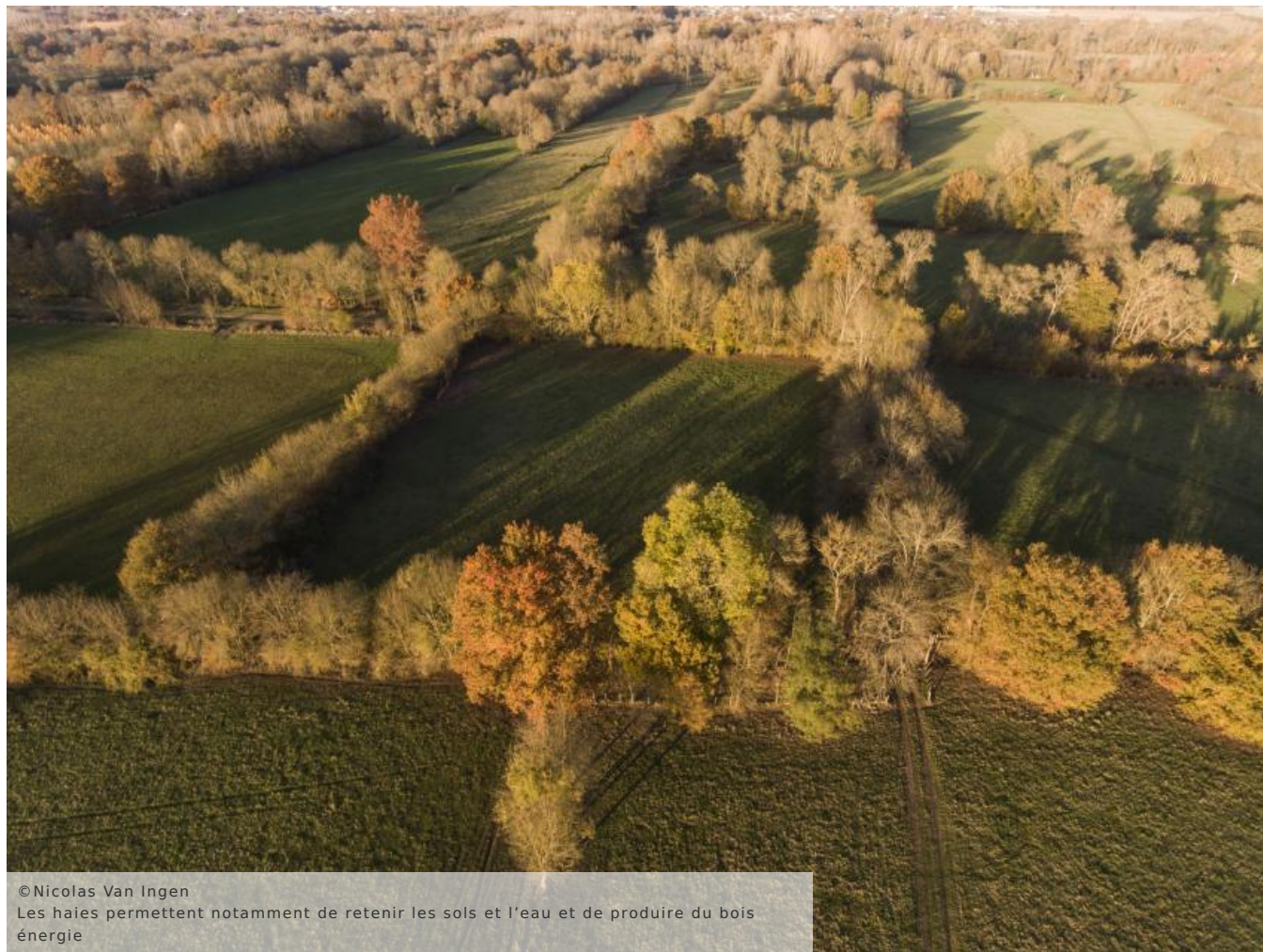
Les haies permettent notamment de retenir les sols et l'eau et de produire du bois énergie

octobre 2010) : « La Trame verte et bleue est un outil d'aménagement du territoire qui vise à (re)constituer un réseau écologique cohérent, à l'échelle du territoire national, pour permettre aux espèces animales et végétales, de circuler, de s'alimenter, de se reproduire, de se reposer... En d'autres termes, d'assurer leur survie, et permettre aux écosystèmes de continuer à rendre à l'homme leurs services. »