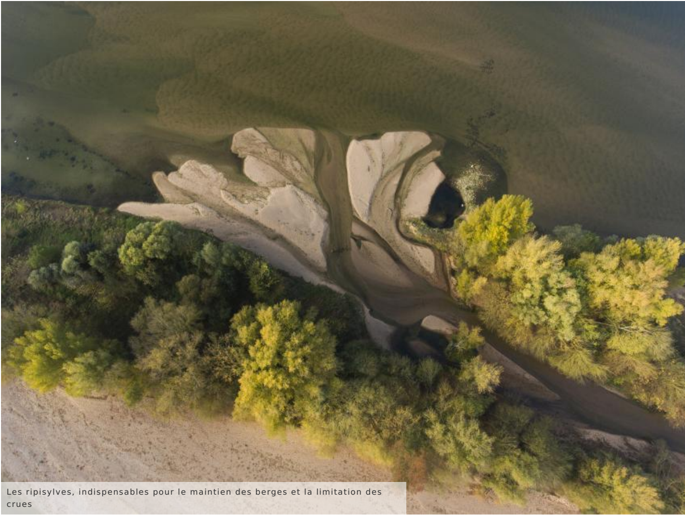
Les ripisylves, indispensables pour le maintien des berges et la limitation des crues