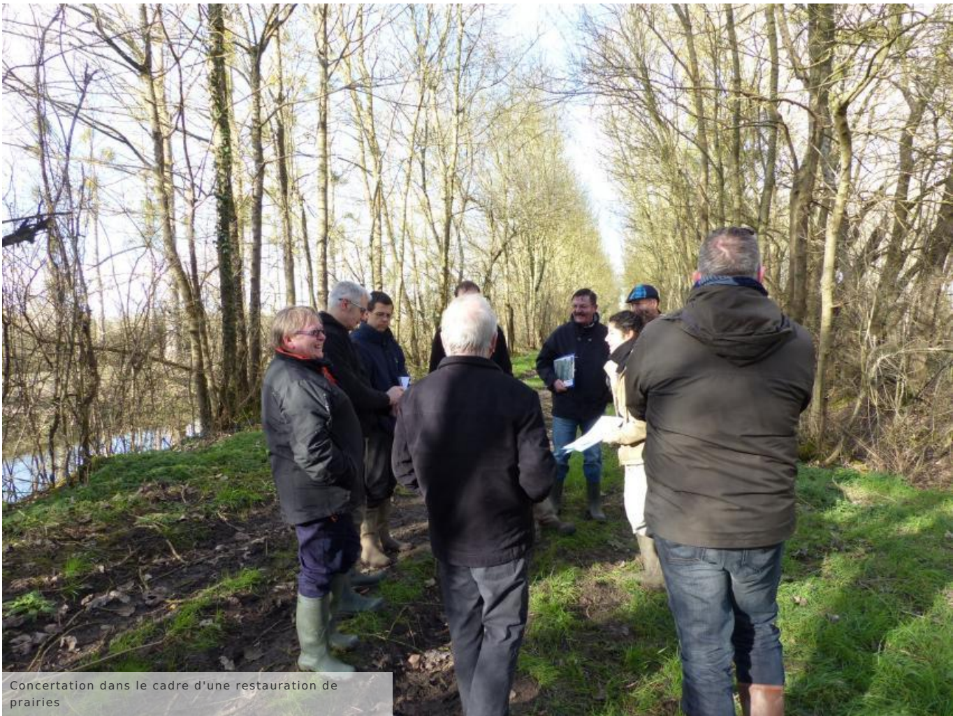
Concertation dans le cadre d'une restauration de prairies