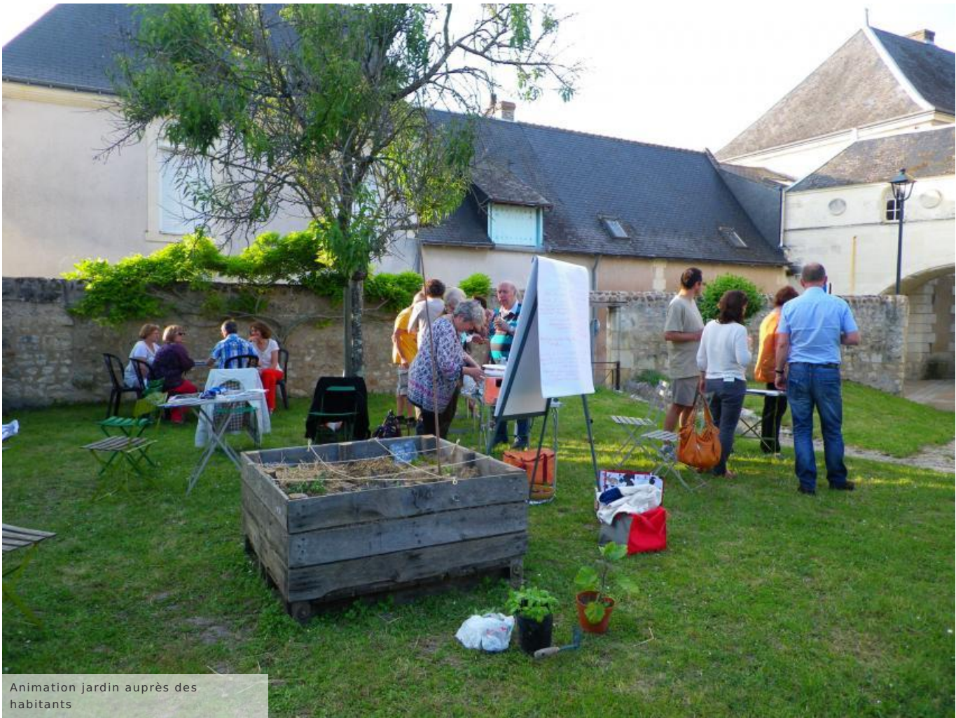
Animation jardin auprès des habitants