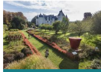
Château et Jardins du Rivau