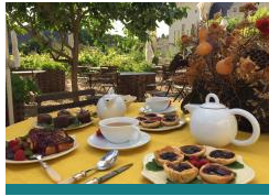
La Table des Fées