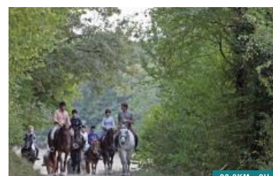
La Breille-les-Pins - Brain-sur-Allonnes

ATTELAGE A VTT ET A CHEVAL FORÊT Bourgueil