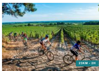
Entre vignes et forêts

ATTELAGE A VTT ET A CHEVAL FORÊT Bourgueil