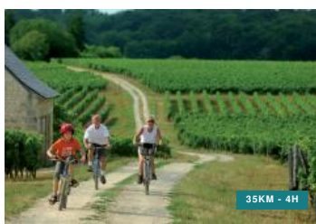
Entre forêts et clairières

ATTELAGE A VTT ET A CHEVAL FORÊT Bourgueil