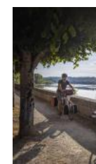
Au gré de la

ATTELAGE A VTT ET A CHEVAL FORÊT La Breille-les-Pins