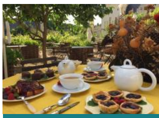
La Table des Fées