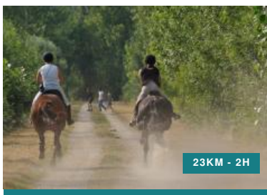
Sur les traces de Rabelais