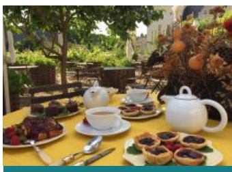
La Table des Fées