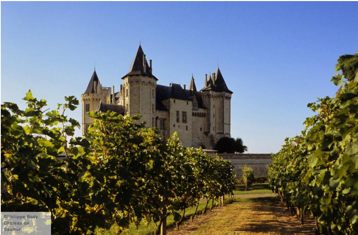
Château de Saumur

Au milieu du XI e siècle, le comte d'Anjou prend le pouvoir sur le territoire. Tout au long des XII e et XIII e siècles, alors que Plantagenêts et Capétiens se disputent la province, un réseau d'édifices secondaires vient compléter le système défensif organisé autour des forteresses, et renforcer l'influence des seigneurs successifs. Certains ont conservé leurs allures de châteaux forts (Montsabert, Crissay-sur-Manse, etc.), tandis que d'autres ont été remaniés dans une optique plus résidentielle, comme le château de Brézé ou le château de Gizeux .