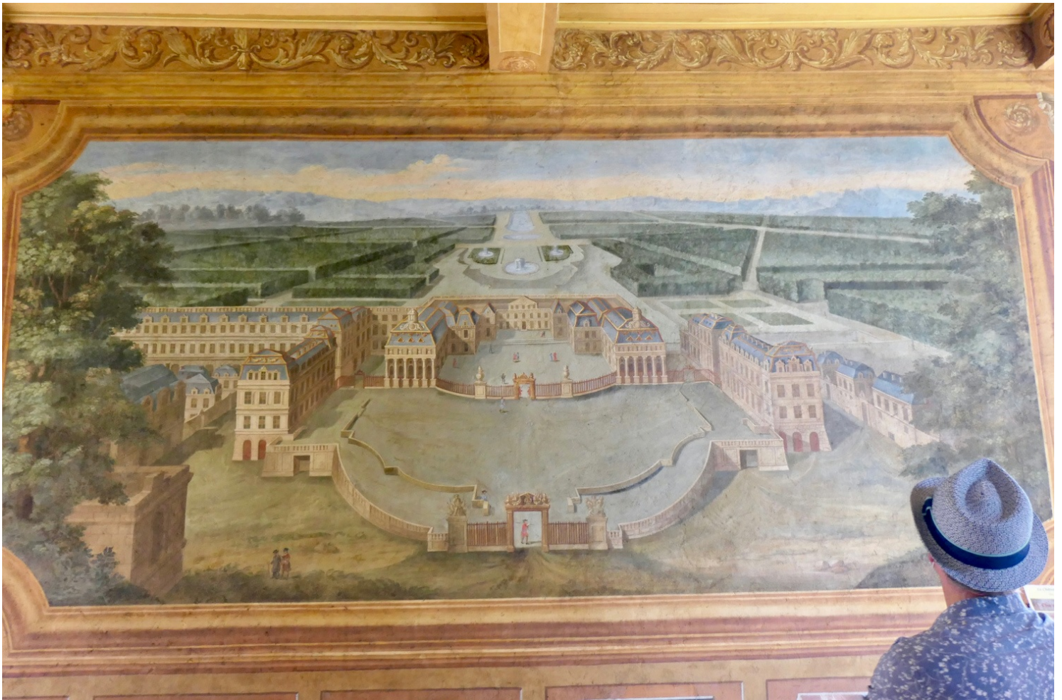
Représentation du château de Versailles