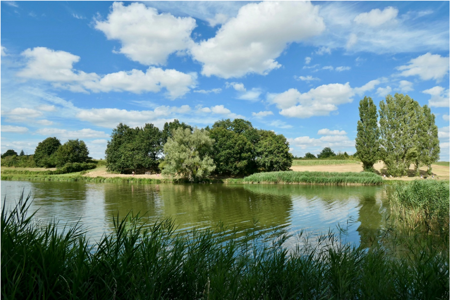
Rives du lac de Rillé

Nous traversons la phragmitaie avec des allures de pionniers et grimpons dans l'observatoire. La vue est splendide sur le lac (c'est le plus grand plan d'eau intérieur du Centre-Ouest) et la roselière, mais nous observons peu d'oiseaux en cette fin d'après-midi encore chaude.