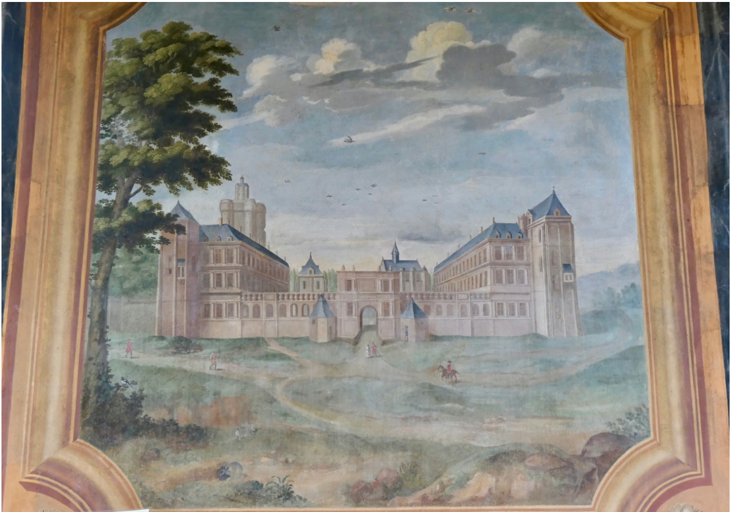
Représentation du château de Vincennes