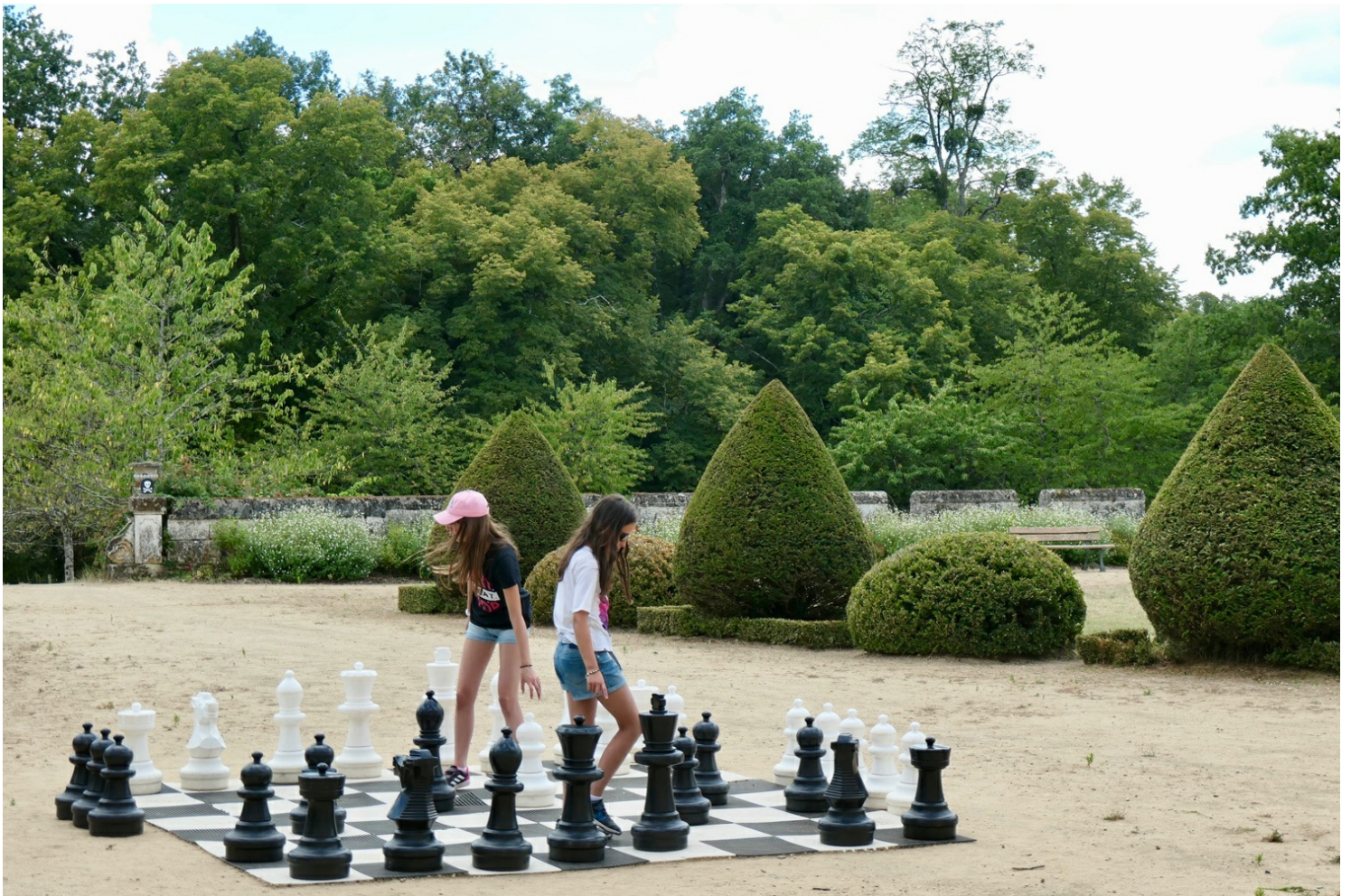
Grande terrasse des jeux

Nous terminons la visite par les écuries où sont exposées d'anciennes calèches. En sortant, nous apprenons en nous amusant sur le sentier d'interprétation de 4 km « L'arbre, des racines à la cime ». L'une des dix stations nous invite à observer avec un astucieux système les loges de pics creusées dans les beaux platanes de 200 ans qui bordent l'allée qui mène au château.