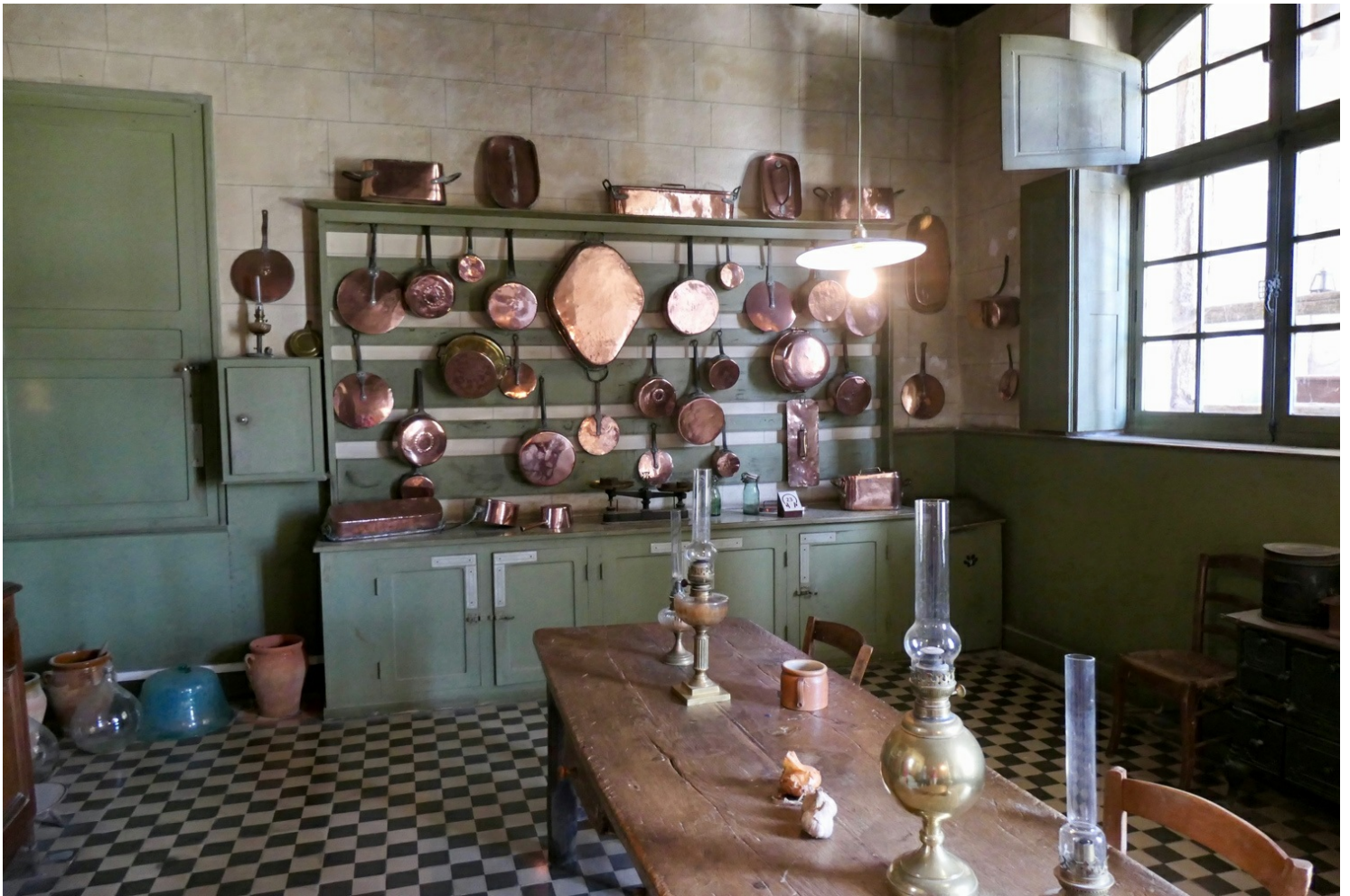
Cuisines du château

Nous apprécions ensuite la fraîcheur des caves, qui courent sur toute la longueur du château : le guide nous indique l'entrée d'un tunnel de 2 km qui allait jusqu'à l'église de Continvoir pour s'y réfugier en cas d'attaque !