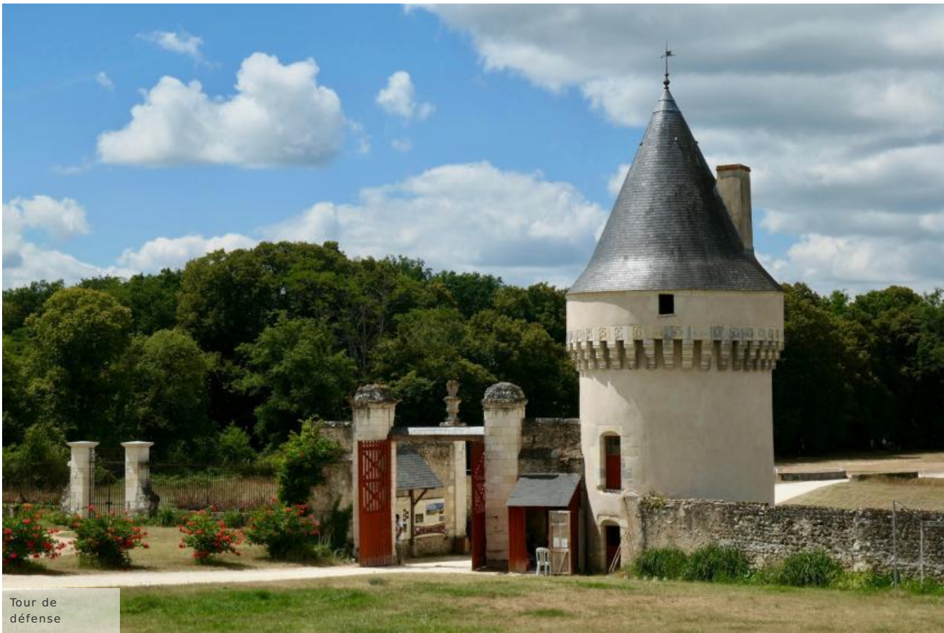
Tour de défense