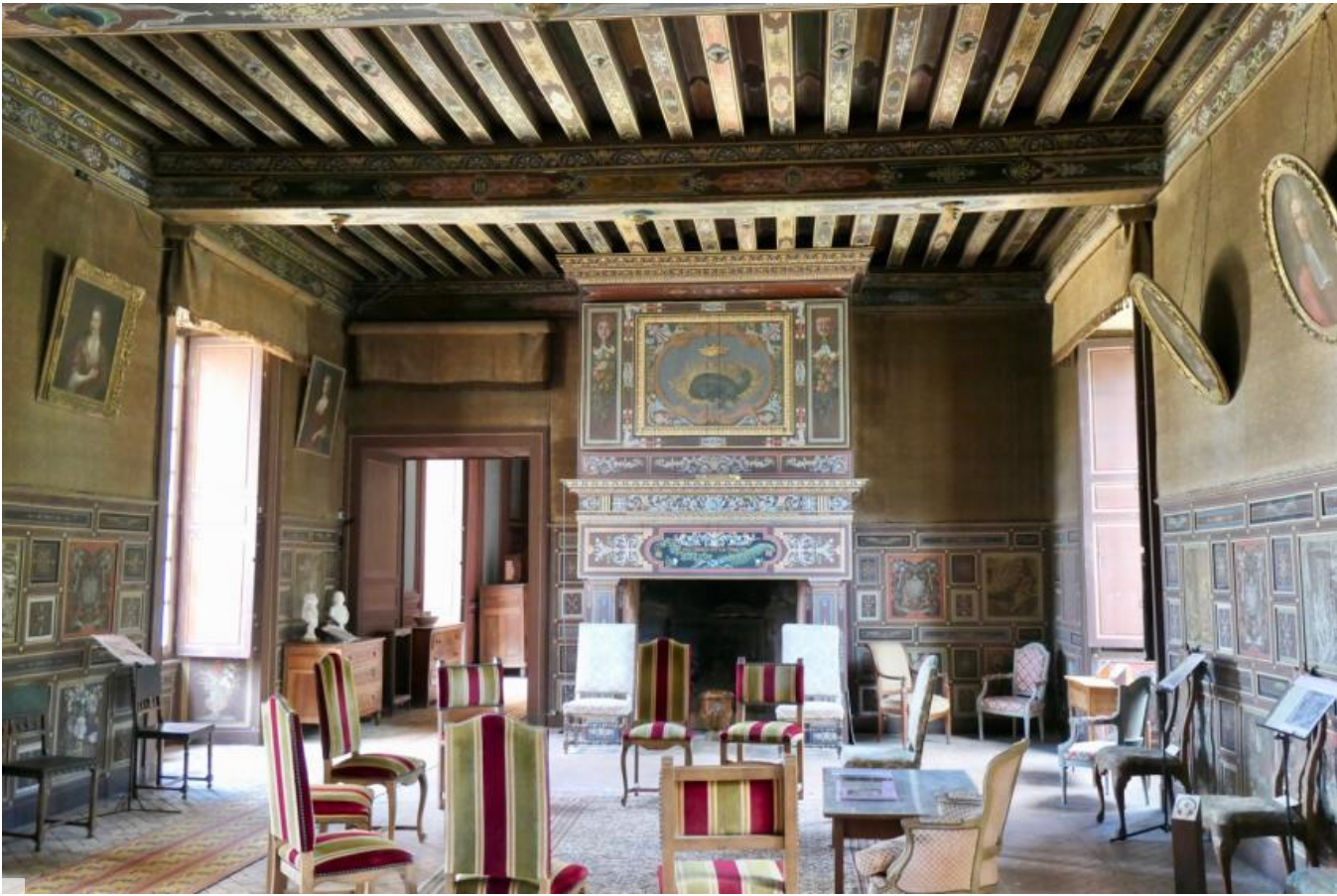
Galerie François 1er