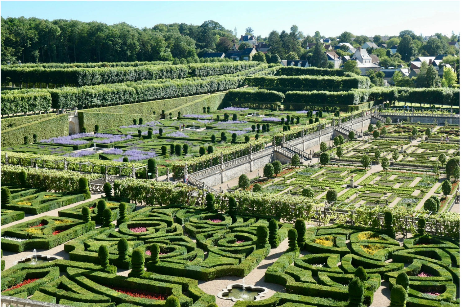
Vue sur les jardins

Nous empruntons un chemin qui domine d'une trentaine de mètres les jardins. Impossible de résister à la tentation de retirer nos sandales sur le gazon ras... Nous surplombons ensuite le "Jardin d'eau" et le château. Ce miroir aquatique rassemble les eaux nécessaires à l'irrigation des jardins et à l'alimentation des fontaines.