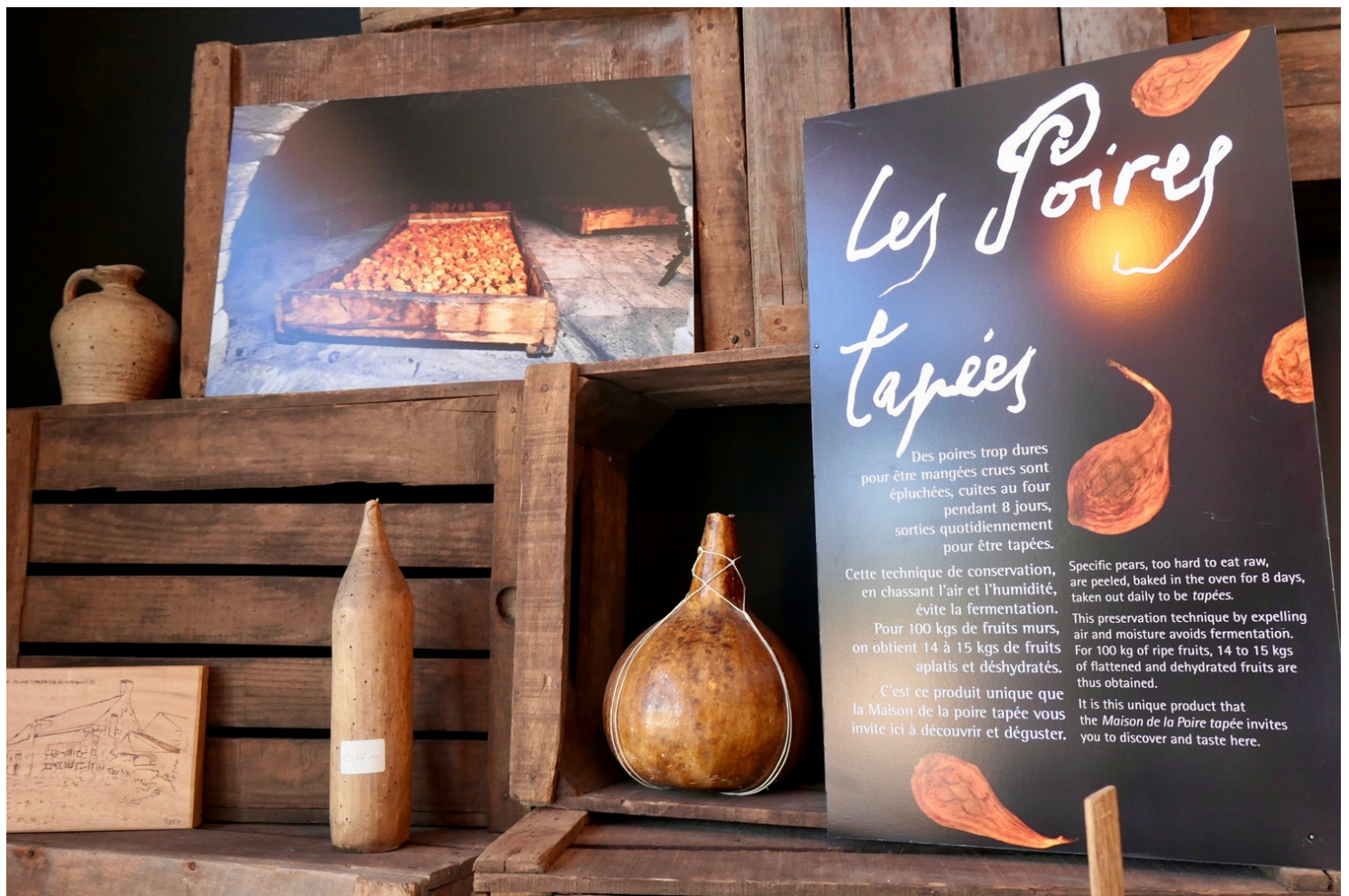
Maison de la poire tapée

C'est ce geste, toujours pratiqué à la main, qui leur vaut leur nom : les poires sont en effet aplaties à l'aide d'un instrument spécifique, la "platissoire". "Cela permet de retirer la bulle d'air autour du pépin et garantit une parfaite conservation," nous explique Valérie, l'une des animatrices du lieu.