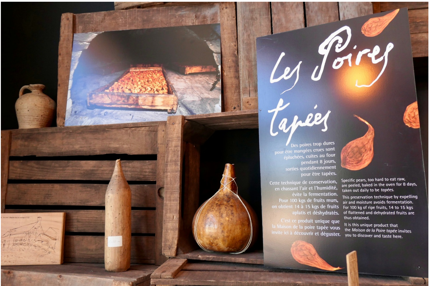
Maison de la poire tapée

C'est ce geste, toujours pratiqué à la main, qui leur vaut leur nom : les poires sont en effet aplaties à l'aide d'un instrument spécifique, la "platissoire". "Cela permet de retirer la bulle d'air autour du pépin et garantit une parfaite conservation," nous explique Valérie, l'une des animatrices du lieu.