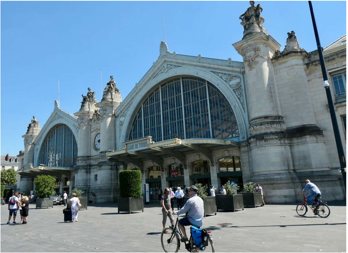
Gare de Tours

Il nous reste à trancher sur l'issue de notre soirée dans cette belle Ville d'Art et d'Histoire : place Plumereau, en mode touristes, pour ses hautes maisons à pans de bois ? Ou à la quinquette de Tours-sur-Loire , pour retrouver encore une fois ce fleuve qui nous est si cher ?