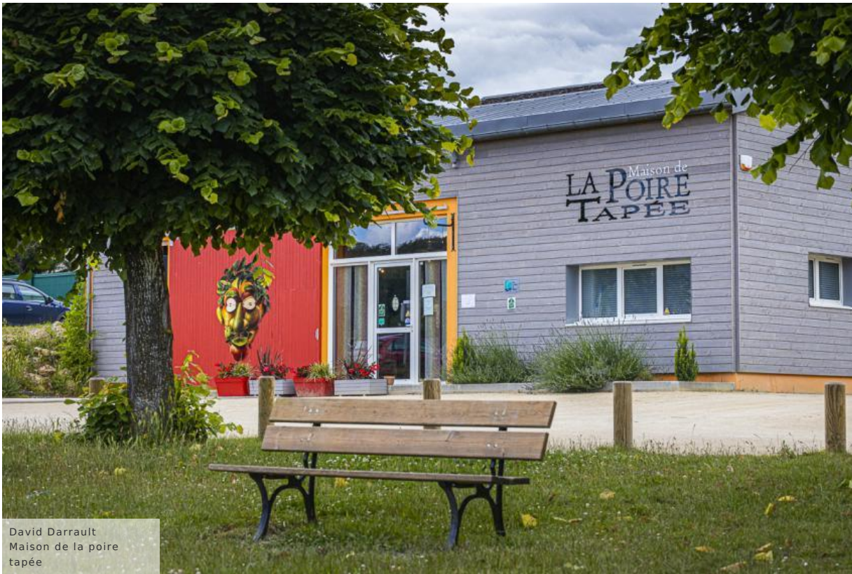
David Darrault Maison de la poire tapée