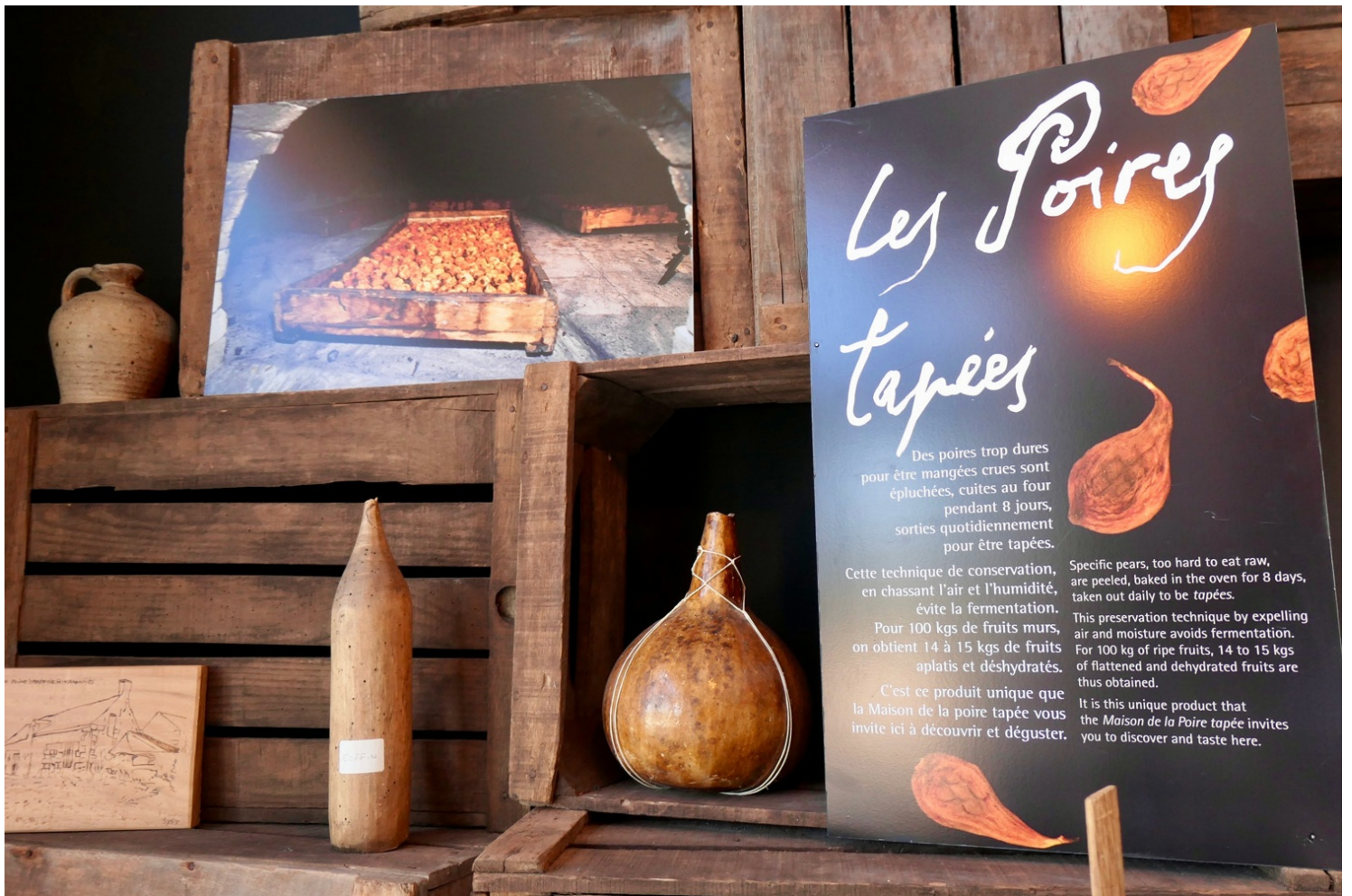
Maison de la poire tapée

C'est ce geste, toujours pratiqué à la main, qui leur vaut leur nom : les poires sont en effet aplaties à l'aide d'un instrument spécifique, la "platissoire". "Cela permet de retirer la bulle d'air autour du pépin et garantit une parfaite conservation", nous explique Valérie, l'une des animatrices du lieu.