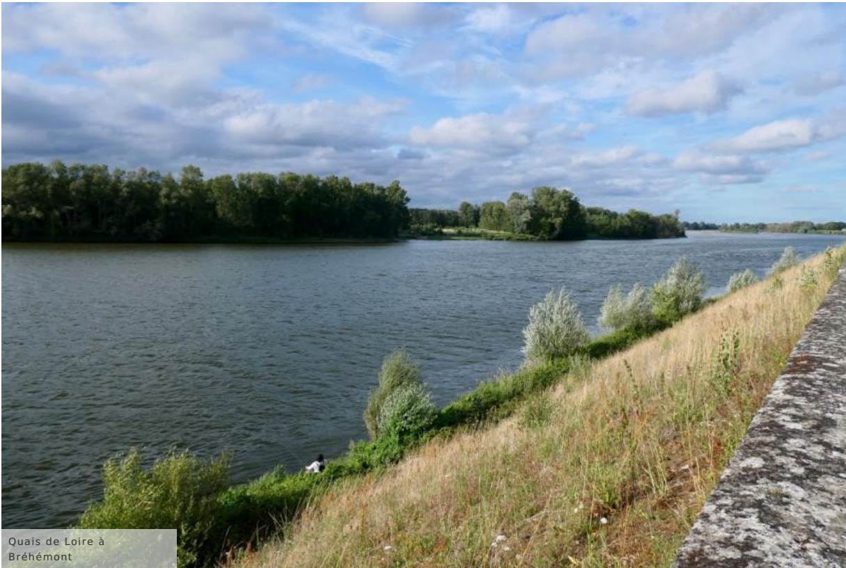
Quais de Loire à Bréhémont

Bréhémont est notre dernière étape du jour. Le plus ancien port pavé de Touraine fut aussi la capitale du chanvre au milieu du 19 e siècle, avec plus de 500 chanvriers ! Plus de 120 fours subsistent sur la commune : ils servaient à sécher les tiges pour en extraire la fibre utilisée pour fabriquer les vêtements, cordages et voiles de bateaux. Une randonnée pédestre " Entre Indre et Loire " de 12 km permet d'en découvrir quelques-uns : elle part de l'église Sainte-Marie-Madeleine (19 e ), dont le chœur n'est pas orienté vers l'Est comme le veut la règle, mais vers l'Ouest !