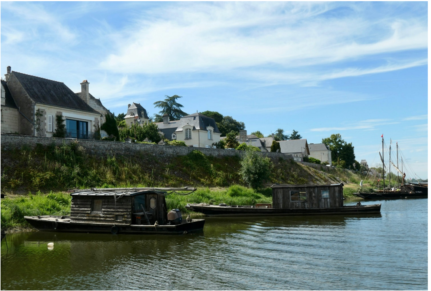
Toutes et futreaux amarrés au Thourel