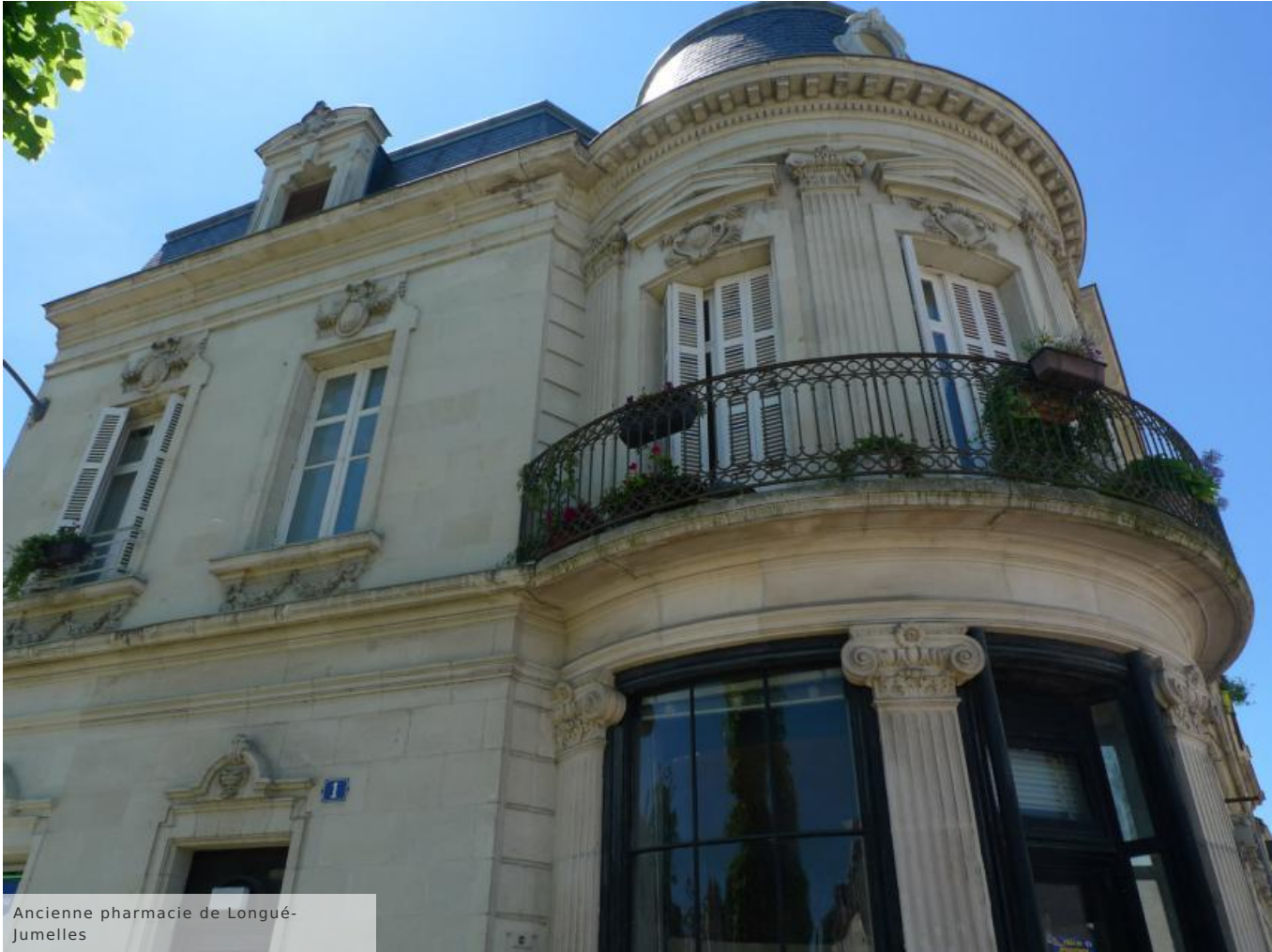
Ancienne pharmacie de Longué-Jumelles