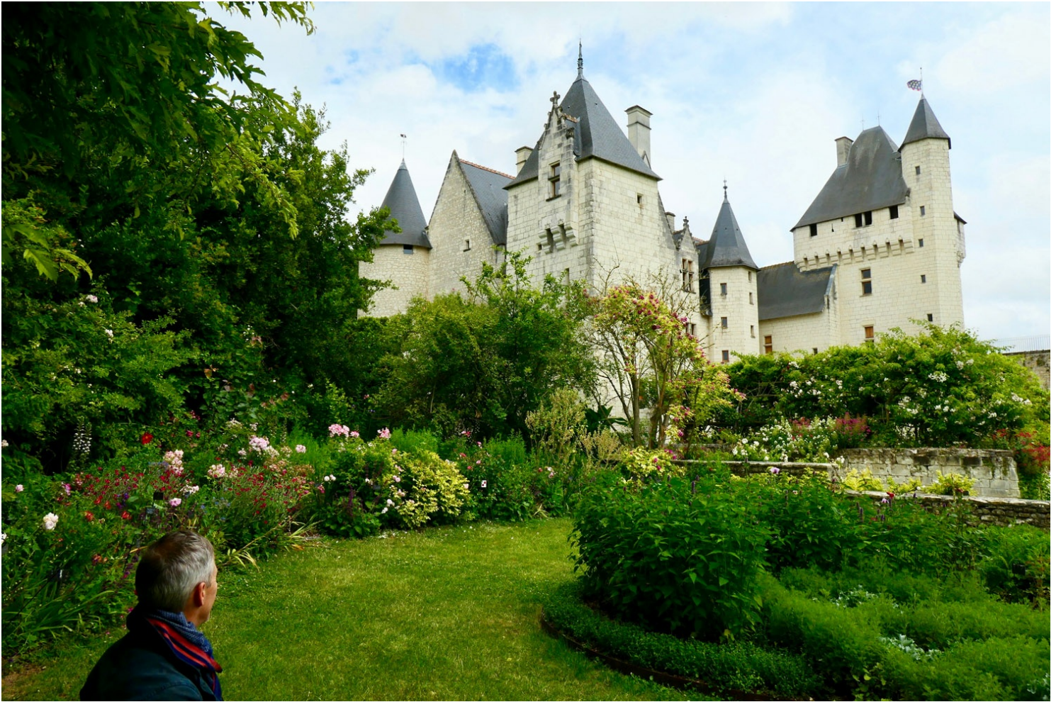
Jardin des philtres d'amour