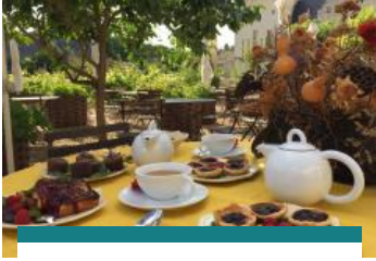
La Table des Fées