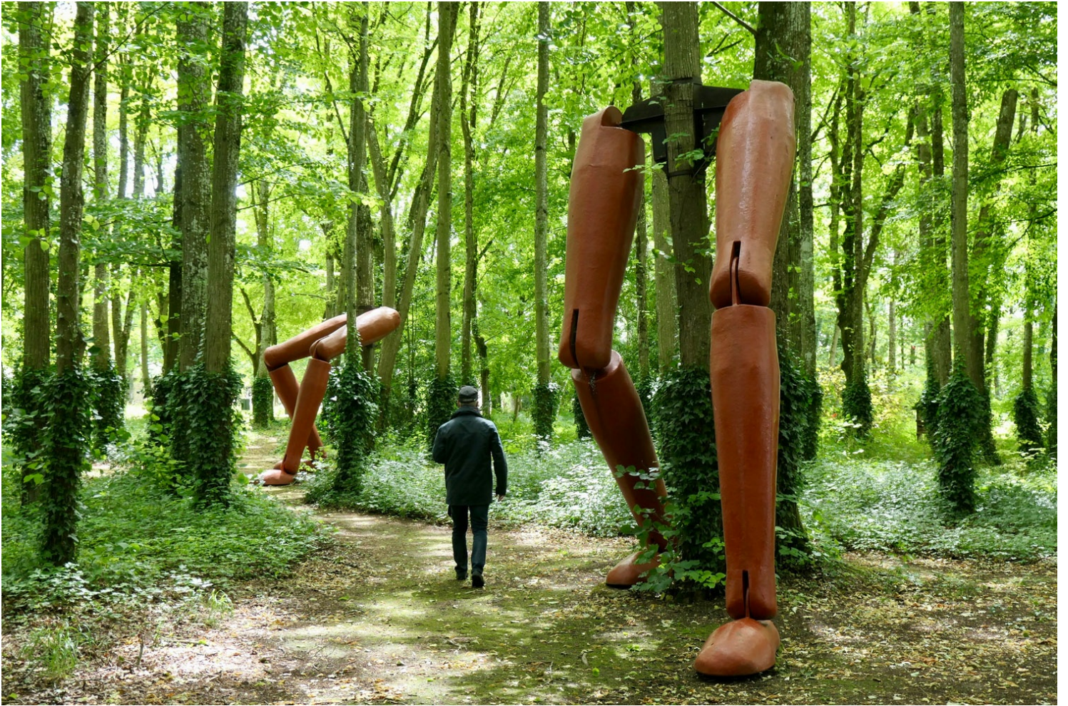
La Forêt qui court

De nombreuses œuvres contemporaines jalonnent ce parcours végétal, dont certaines monumentales. Dans « La Forêt qui court », cinq paires de jambes géantes sont adossées aux arbres.