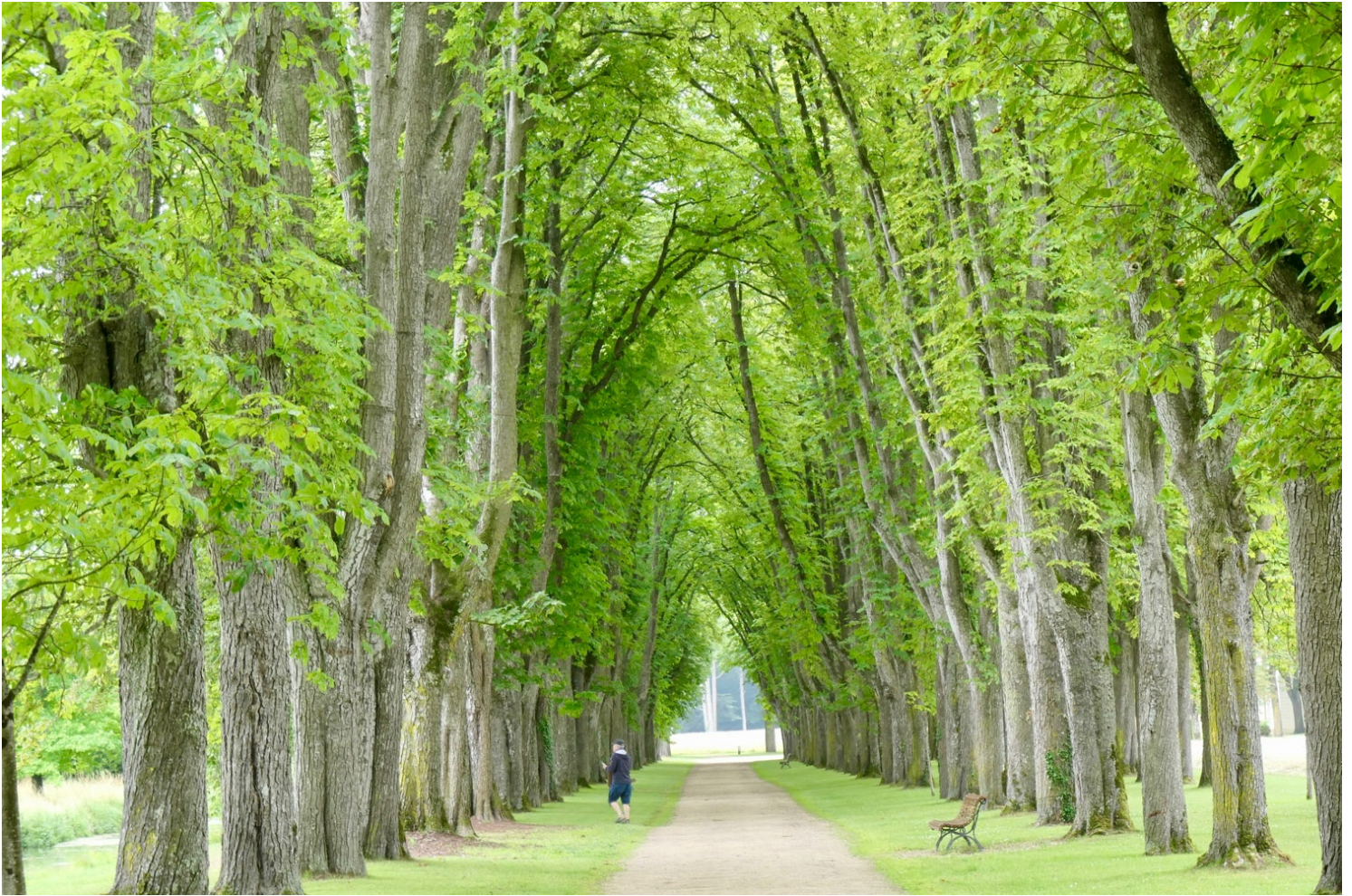
Allée du parc de Richelieu

Nous poursuivons la visite dans l'immense parc de Richelieu en prévision d'une pause au bord de l'eau. C'est ici que fut bâti le plus grand château de France jamais construit avant Versailles, vers 1630. Démoli au 19 e siècle, il n'en reste qu'un dôme, l'orangerie et le chai. Il a été reconstitué en trois dimensions dans l' Espace Richelieu , un hôtel particulier où une scénographie ludique et interactive présente le cardinal.