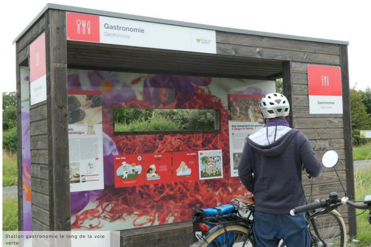
Station gastronomie le long de la voie verte

De retour sur la voie verte, la station « Gastronomie » nous met en appétit. Un peu plus loin sur la droite, s'étend un champ de chênes truffiers comme on en voit souvent dans le Richelais, depuis la relance de cette culture traditionnelle dans les années 1970.