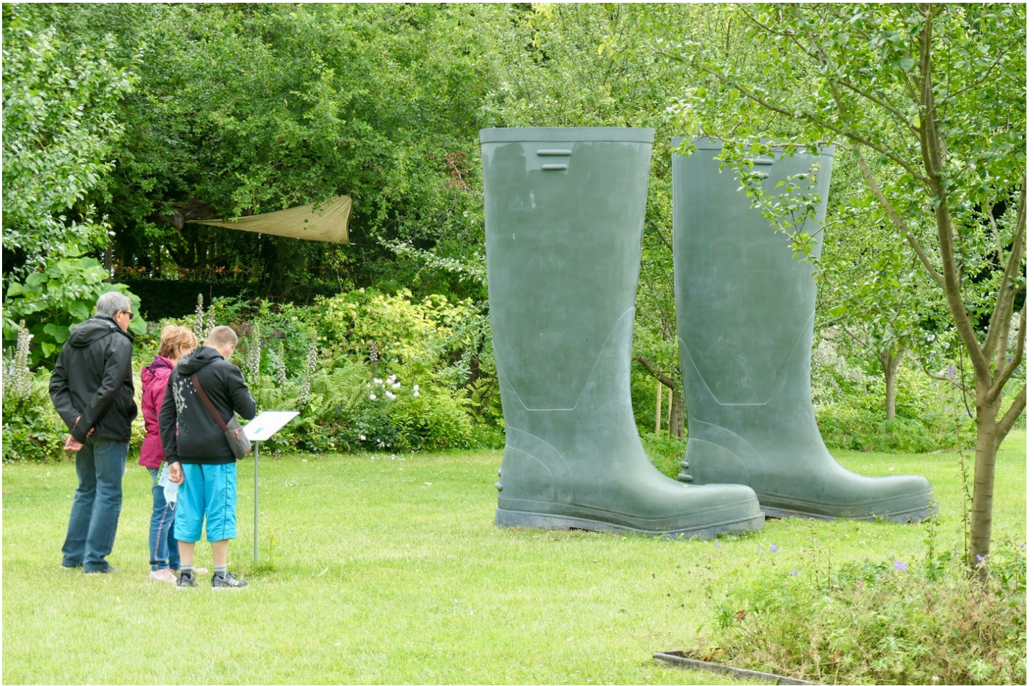
Bottes géantes de Lilian Bourgeat

Même esprit décalé à l'intérieur du château, qui conjugue œuvres du passé et créations contemporaines sur fond d'animation sonore. Dans la cour, jetez un œil dans le puits, couronné de faux capillaires (une espèce de fougère), avant de grimper les marches de l'escalier à vis qui mène au logis seigneurial. Observez au passage sur les murs en tuffeau les rares graffitis des tailleurs de pierre du 15 e siècle.