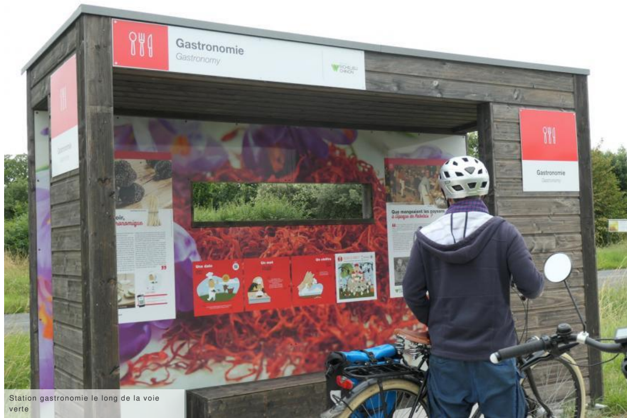
Station gastronomie le long de la voie verte

De retour sur la voie verte, la station « Gastronomie » nous met en appétit. Un peu plus loin sur la droite, s'étend un champ de chênes truffiers comme on en voit souvent dans le Richelais, depuis la relance de cette culture traditionnelle dans les années 1970.