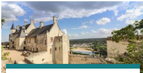
Une parenthèse historique au pays de Rabelais