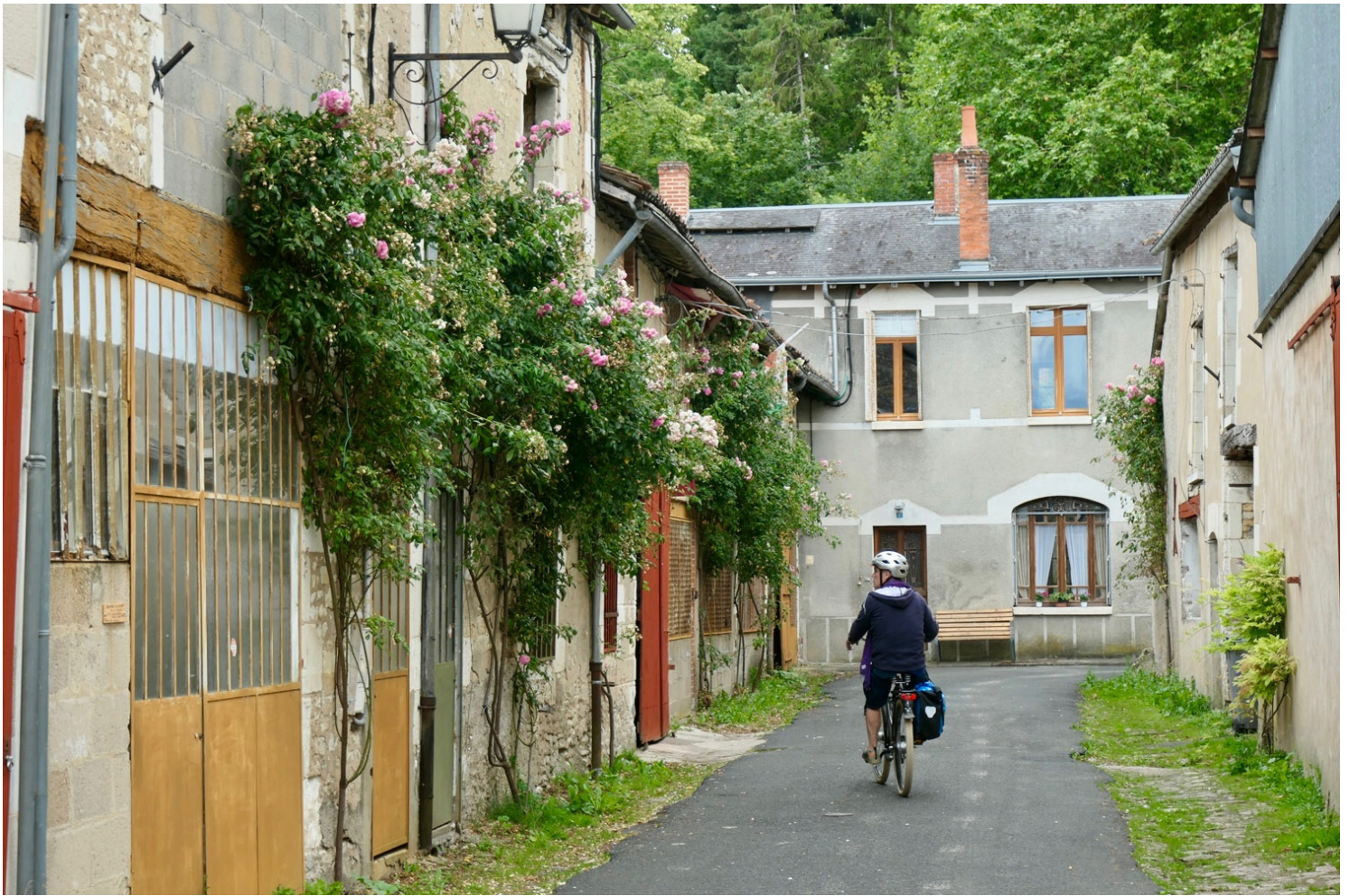
Ruelles de Richelieu et portes peintes

UN VASTE PARC QUI ABRITA LE CHÂTEAU DU CARDINAL