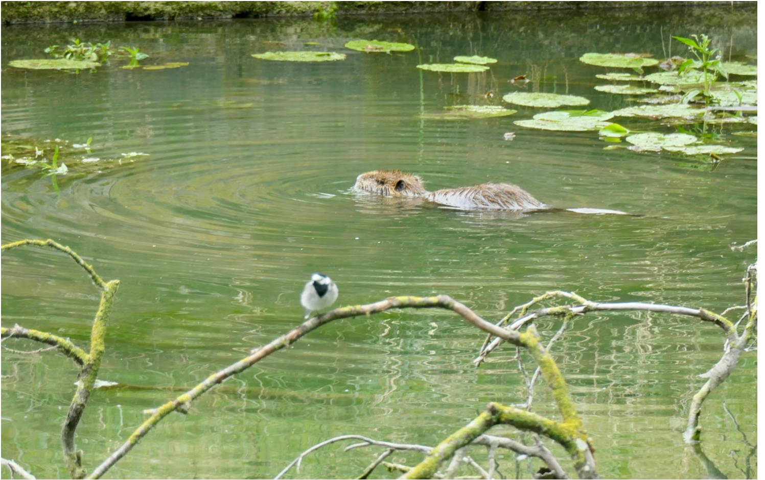
Ragondin et bergeronnette