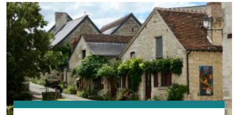
Architecture, vignoble et village classé en sud Touraine