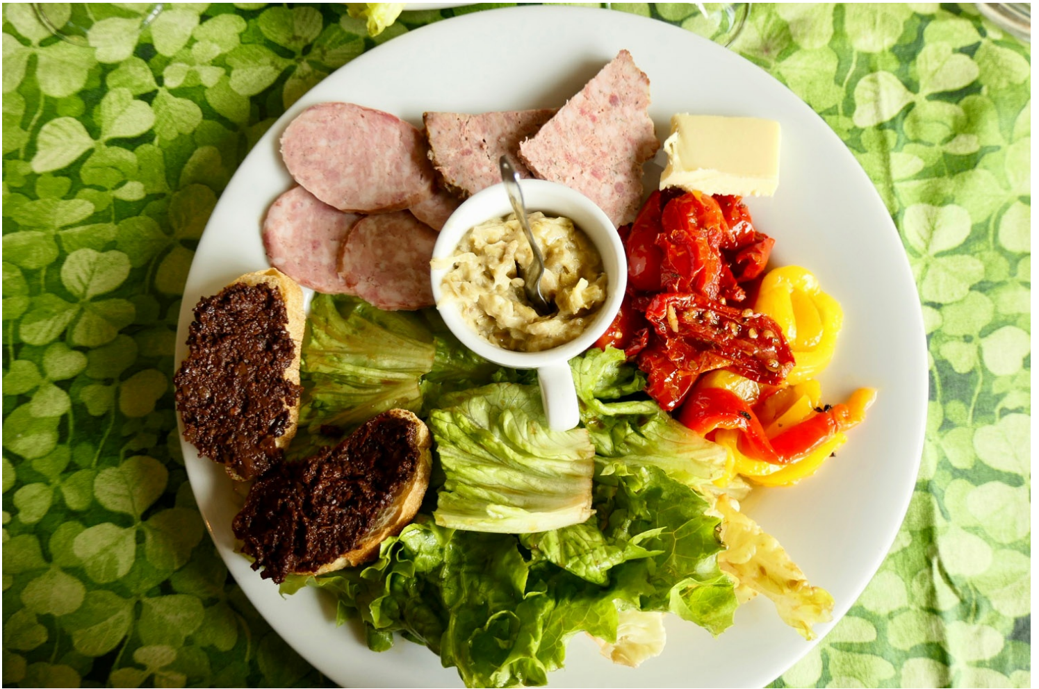
Assiette des fées

Pour les fins gourmets, le château vient d'ouvrir un tout nouveau restaurant gastronomique : Jardin secret . Le Chef Nicolas Gaulandau y propose une cuisine créative et raffinée avec les légumes et plantes comestibles du Rivau.