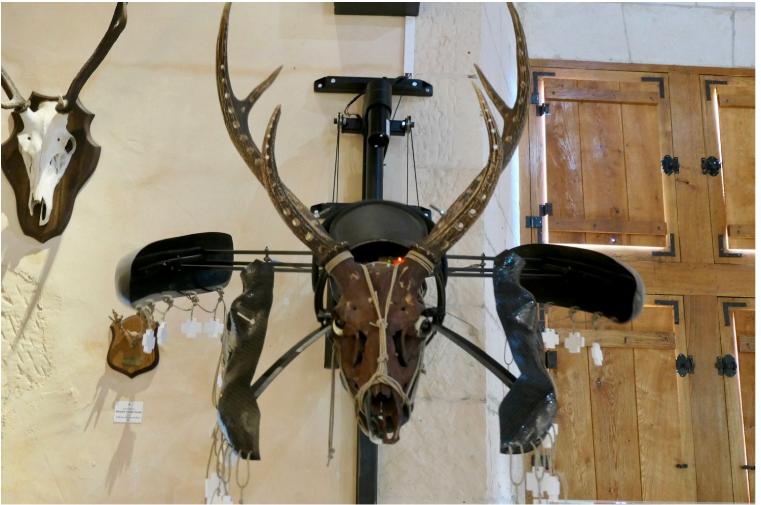
Salle du Grand logis

Dans la salle des Dames, les petites filles s'extasient devant la Couronne géante ornée de pierres. Les pièces dédiées à Jeanne d'Arc rappellent que la "Pucelle" fit étape au Rivau pour y guérir les chevaux de ses cavaliers, avant le siège d'Orléans.