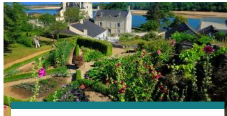
Déambulation de Montsoreau à Candes-Saint-Martin, deux villages classés