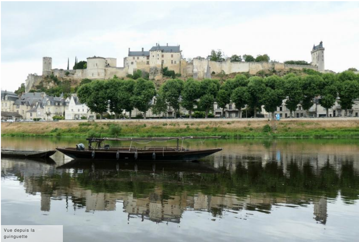
Vue depuis la guinguette