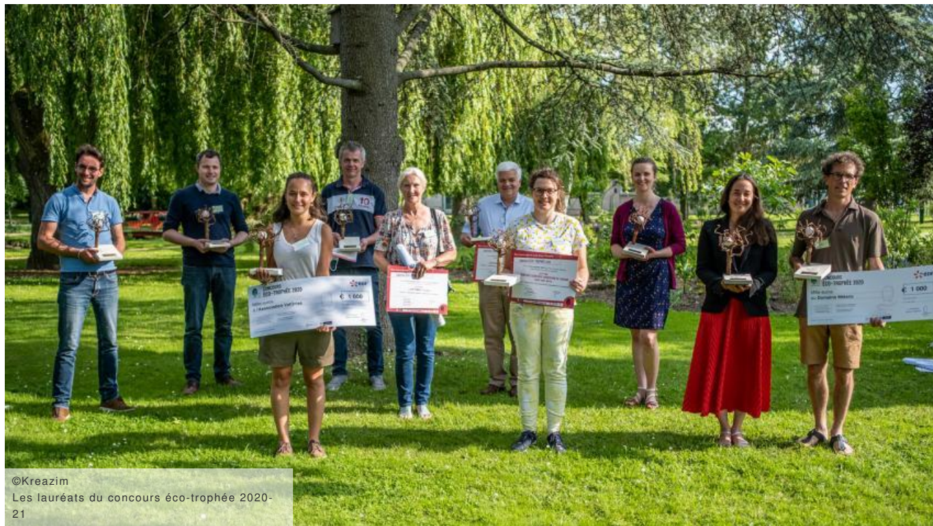
Les lauréats du concours éco-trophée 2020- 21