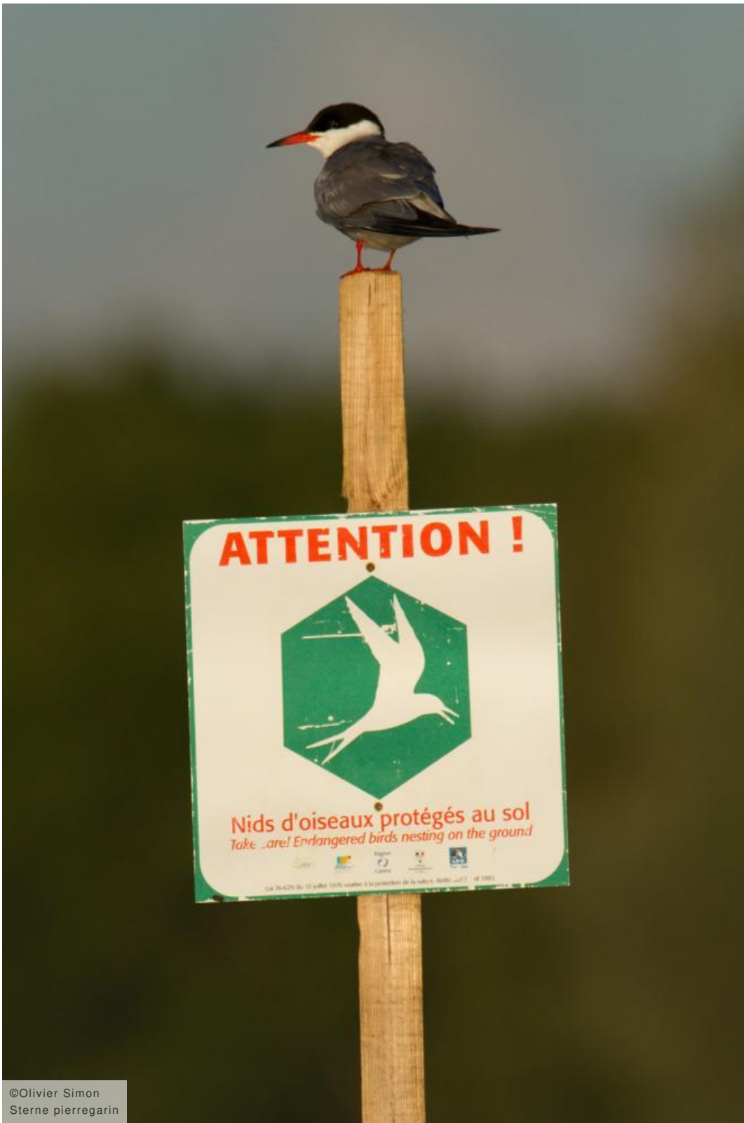
Sterne pierregarin