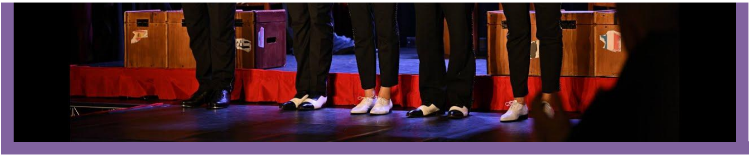
TABLE-RONDE "CLIMAT, CULTURE ET CHANGEMENT DE COMPORTEMENT"