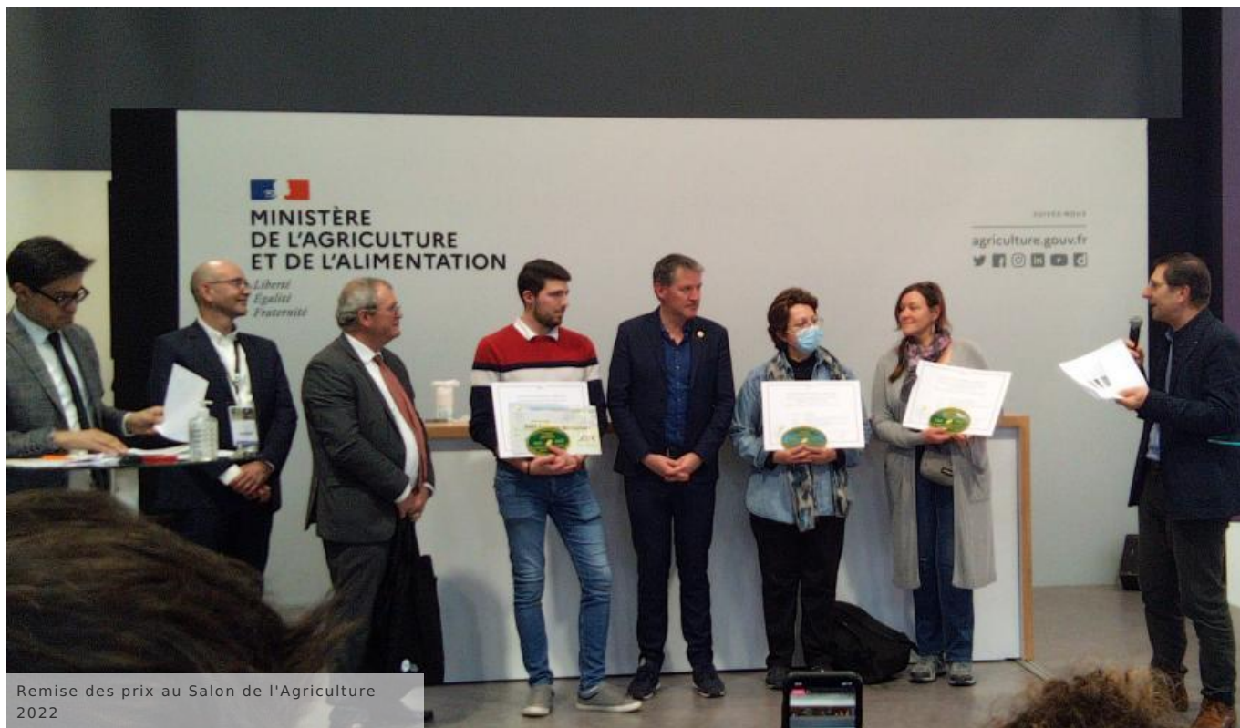
Remise des prix au Salon de l'Agriculture 2022