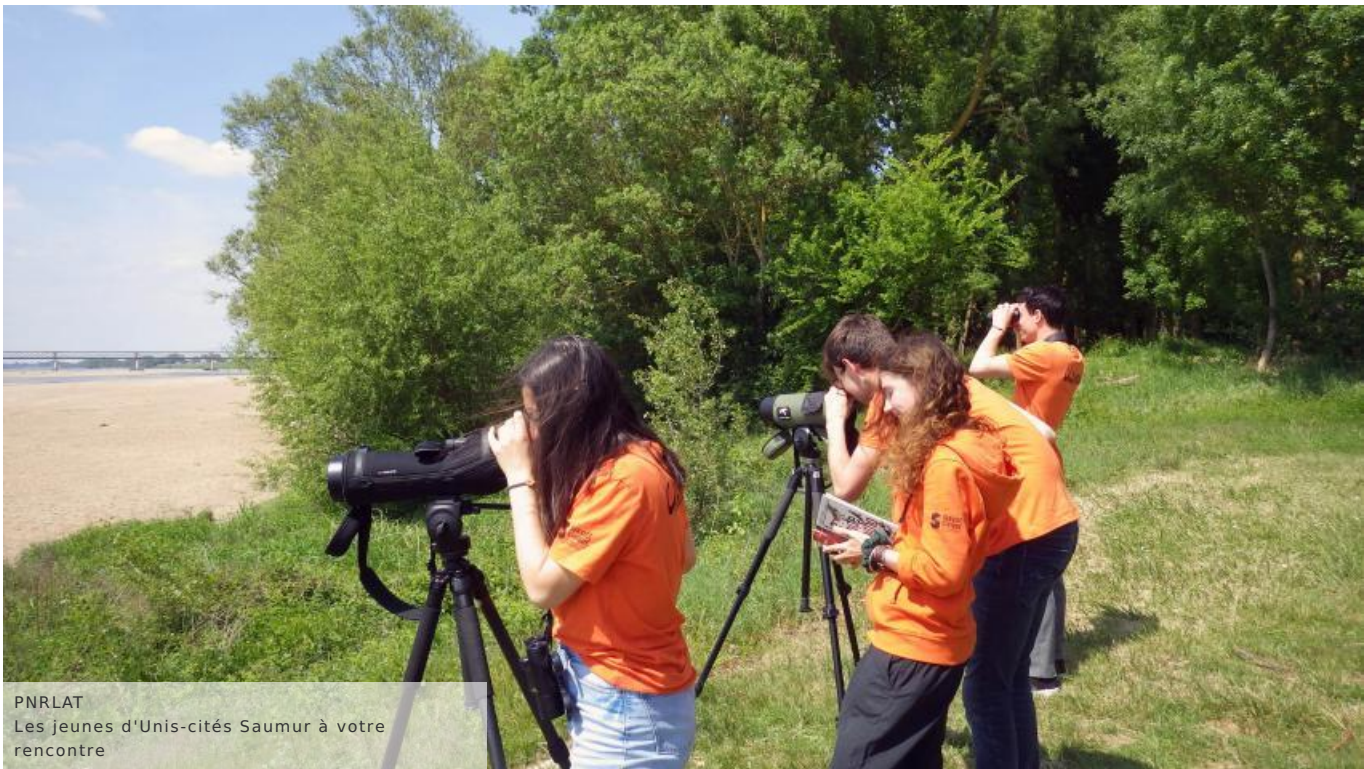
PNRLAT Les jeunes d'Unis-cités Saumur à votre rencontre

*Ces lieux sont susceptibles de modification en fonction de l'installation des oiseaux.