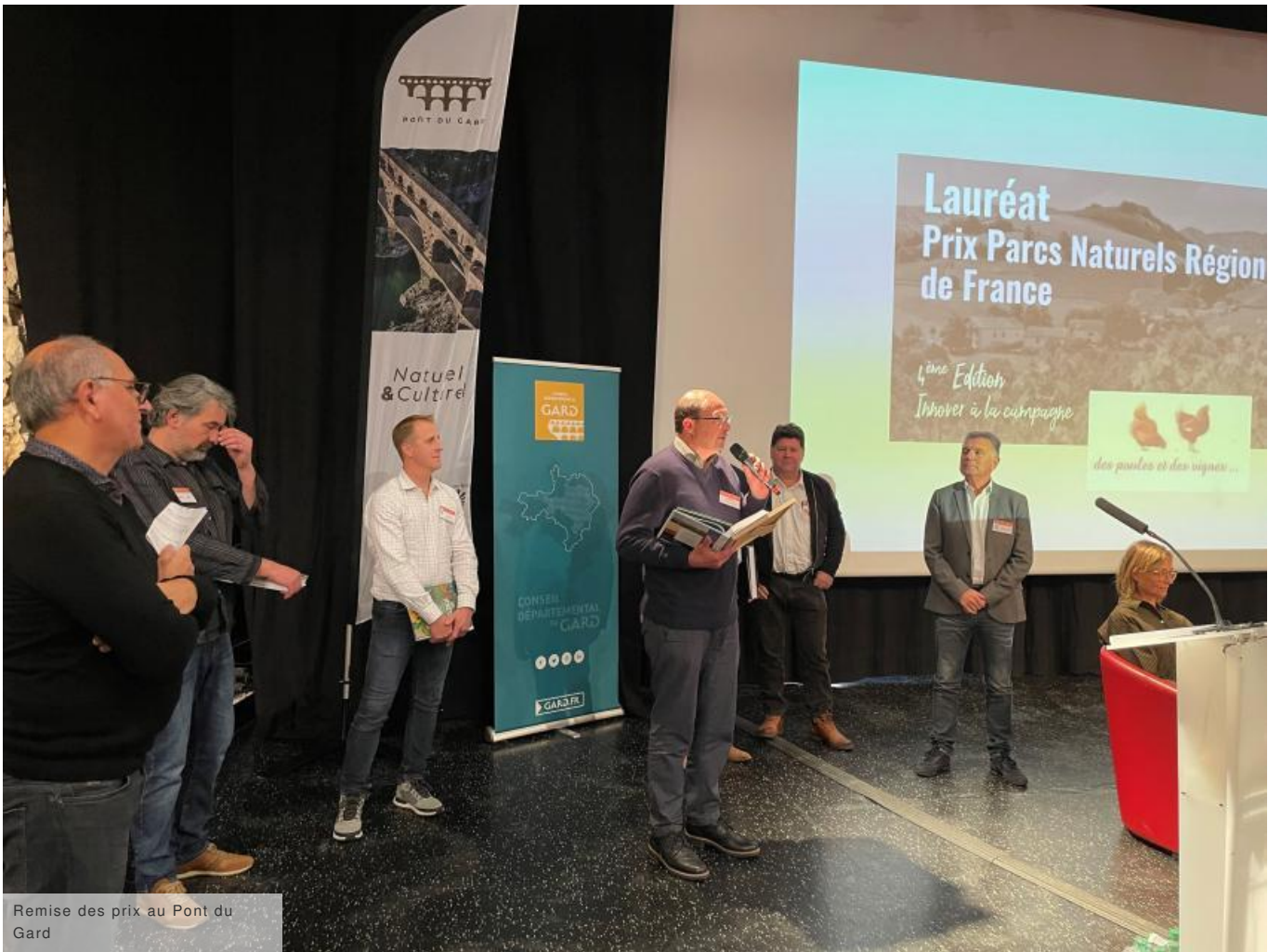
Remise des prix au Pont du Gard