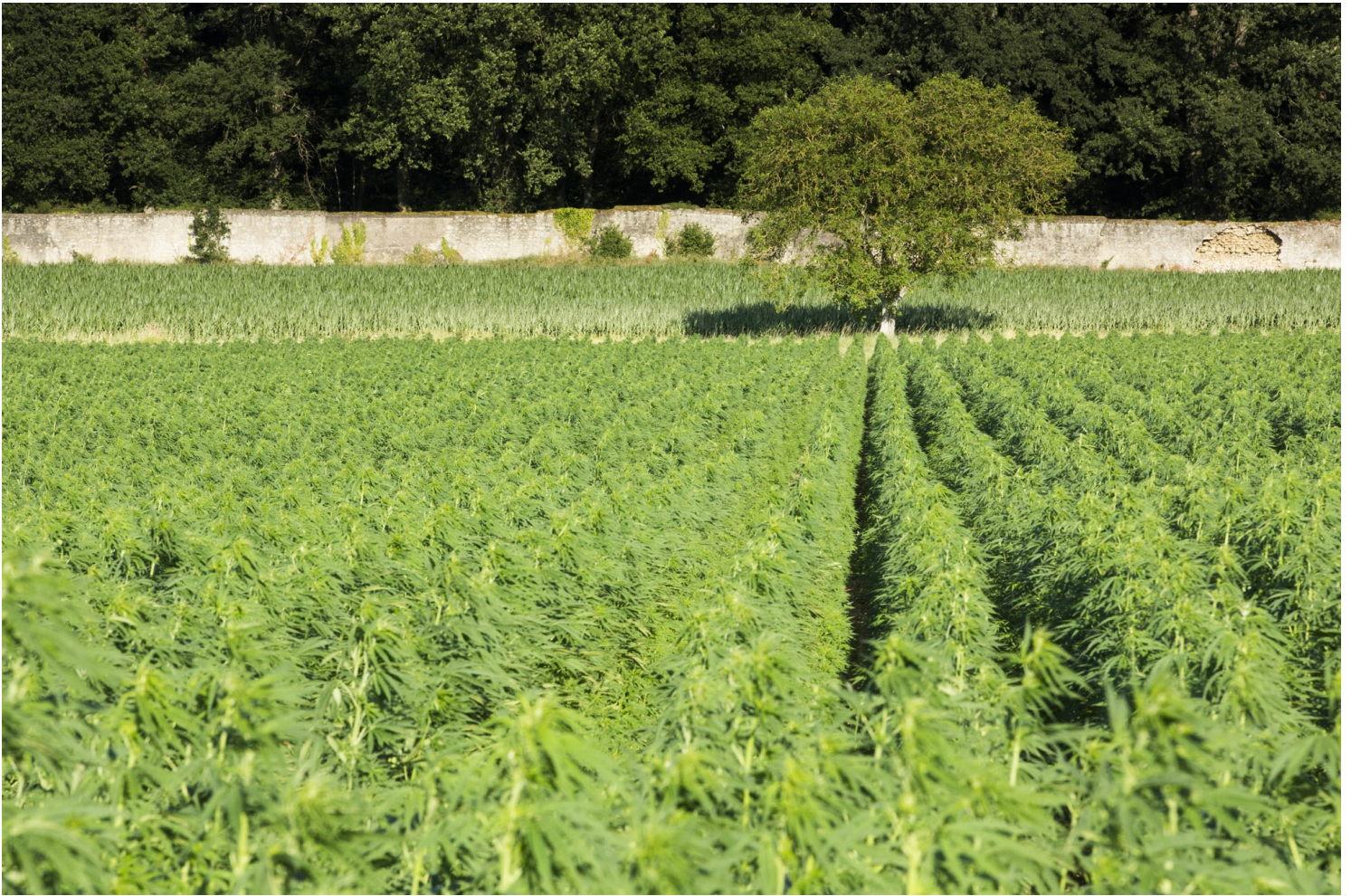
Champs de chanvre dans le Val d'Authion