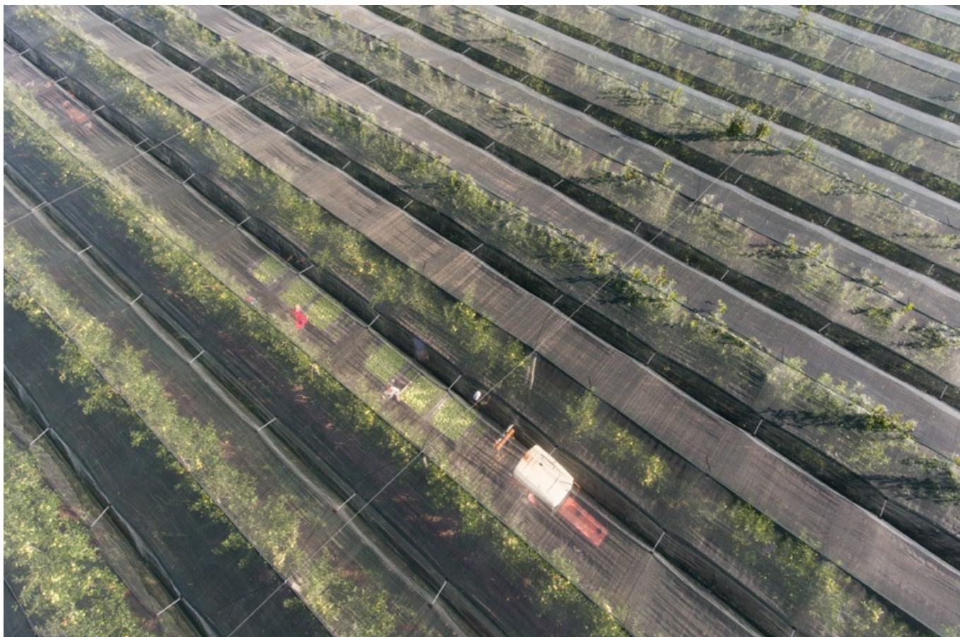
Vue aérienne d'une plantation d'arbres fruitiers à Lignières de Touraine

Comment goûter les fruits du terroir ? Vous pouvez évidemment les manger tels quels, sitôt cueillis de l'arbre. Mais saviez-vous que les pommes et poires de la vallée de la Loire se dégustent également sous forme de fruits tapés ? Cette méthode ancienne de conservation des fruits a donné l'une des meilleures friandises de la région. Séchés, passés au four puis aplatis, les fruits tapés se consomment secs ou réhydratés dans du sirop, du vin... Avant de partir, ne manquez pas de goûter les pommes tapées à Turquant ou les poires tapées à Rivarennnes !