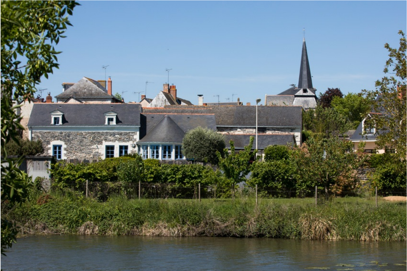
Village de Brain-sur-l'Authion : vue sur les maisons et sur la rivière l'Authion

En parcourant le Val d'Authion, vous serez peut-être surpris par la mosaïque de cultures qui se déploient sous vos yeux. Sur ce territoire, les petites parcelles côtoient les grandes exploitations et les productions sont variées. On y pratique surtout la céréaliculture, l'horticulture et le maraîchage .