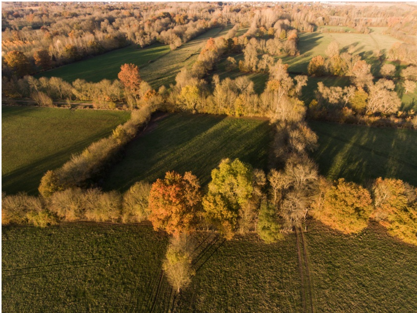
Vue aérienne du bocage en vallée de la Vienne, arbres têtards alignés aux couleurs orangées

En aval de Chinon , le bocage du Véron est caractérisé par son double rideau d'arbres têtards . On reconnaît ces arbres – le plus souvent des frênes – à leur « grosse tête », due à des tailles systématiques entre 1,5 et 2 mètres de hauteur. Après chaque coupe, la cicatrisation vient épaissir le sommet du tronc et dessine une boule. Ce mode d'exploitation spécifique permet d'obtenir du bois de chauffage et de tressage.