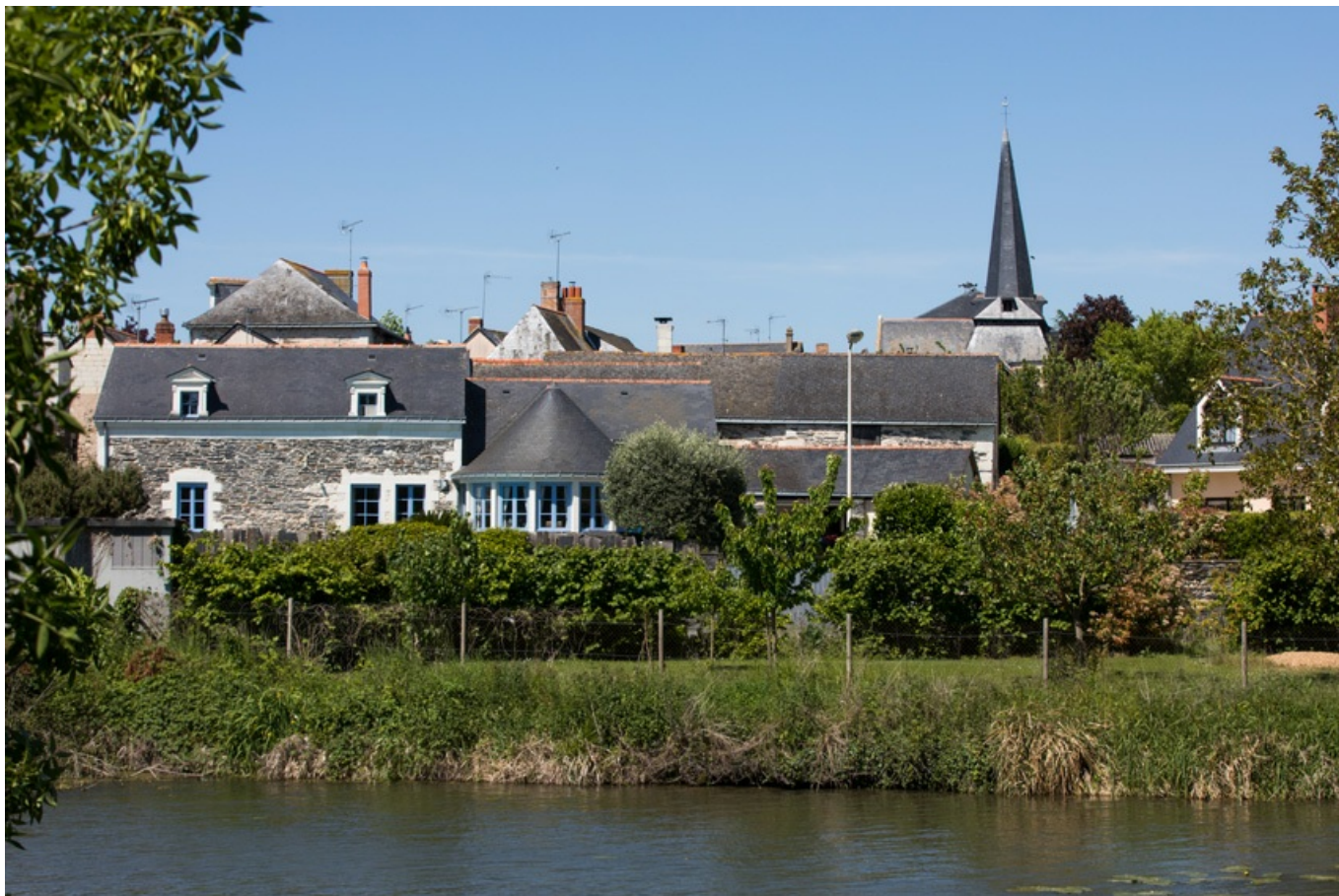
Village de Brain-sur-l'Authion : vue sur les maisons et sur la rivière l'Authion

En parcourant le Val d'Authion, vous serez peut-être surpris par la mosaïque de cultures qui se déploient sous vos yeux. Sur ce territoire, les petites parcelles côtoient les grandes exploitations et les productions sont variées. On y pratique surtout la céréaliculture, l'horticulture et le maraîchage .