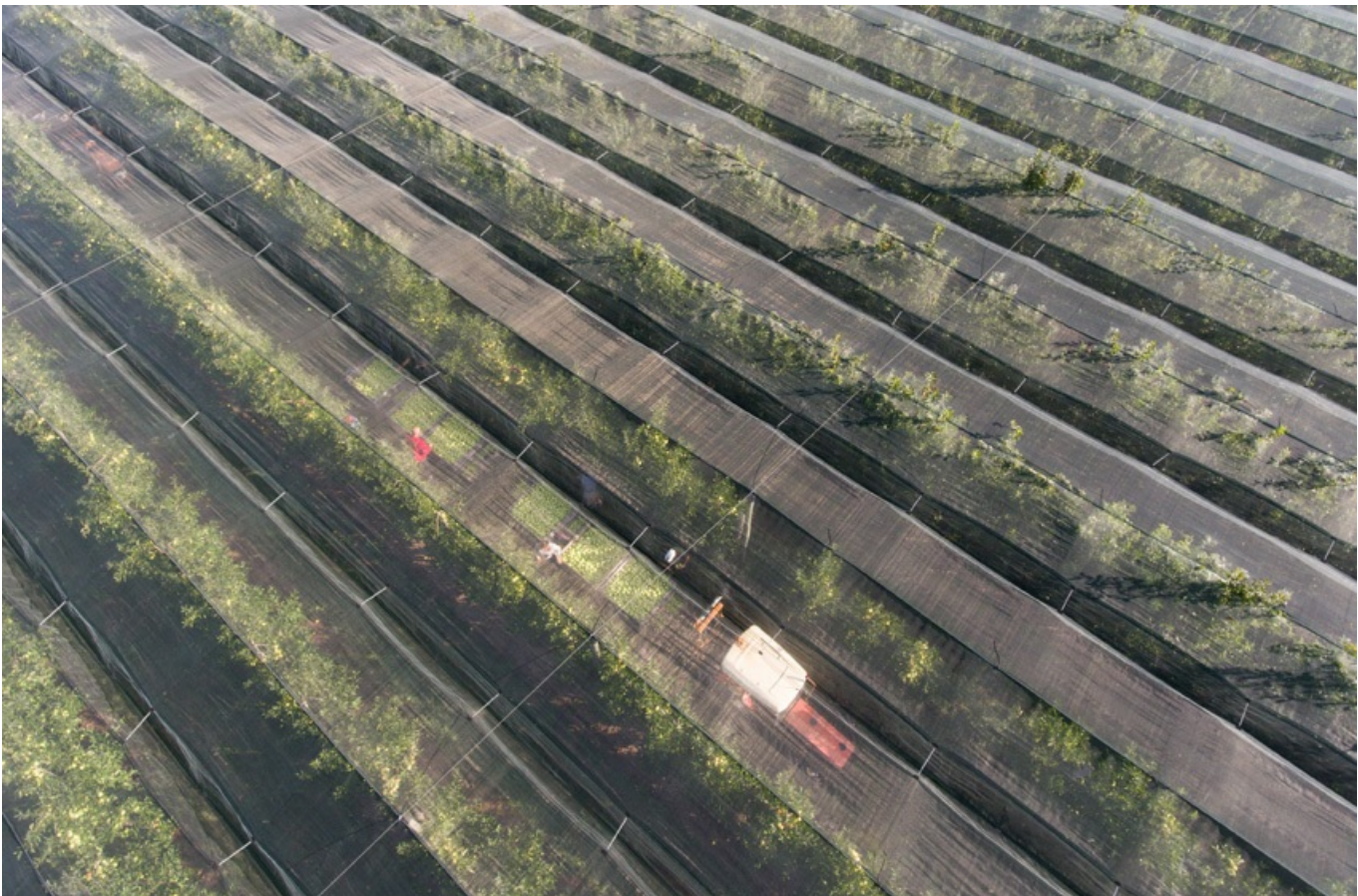
Vue aérienne d'une plantation d'arbres fruitiers à Lignières de Touraine

Comment goûter les fruits du terroir ? Vous pouvez évidemment les manger tels quels, sitôt cueillis de l'arbre. Mais saviez-vous que les pommes et poires de la vallée de la Loire se dégustent également sous forme de fruits tapés ? Cette méthode ancienne de conservation des fruits a donné l'une des meilleures friandises de la région. Séchés, passés au four puis aplatis, les fruits tapés se consomment secs ou réhydratés dans du sirop, du vin... Avant de partir, ne manquez pas de goûter les pommes tapées à Turquant ou les poires tapées à Rivarennnes !