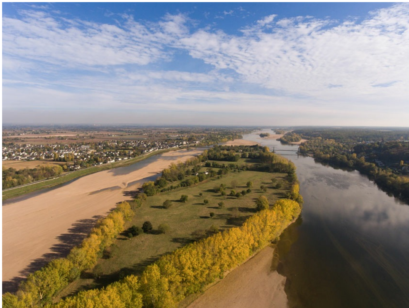
vue sur l'île de Gennes. Faible niveau d'eau en période estivale

Dans ce contexte, les travaux de restauration des boires de Loire, les aménagements destinés à réguler le débit des différentes rivières et l'attention portée à l'équilibre des écosystèmes seront cruciaux pour assurer une gestion durable de la ressource en eau.