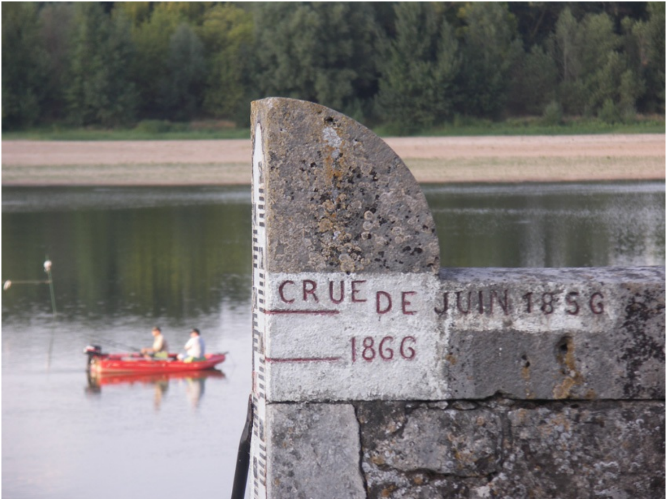
échelle de crue en bord de Loire

et Montsoreau. Parfois simple trait sur un mur, parfois plaque commémorative, ces marques laissent imaginer l'ampleur des dégâts causés par la montée des eaux.