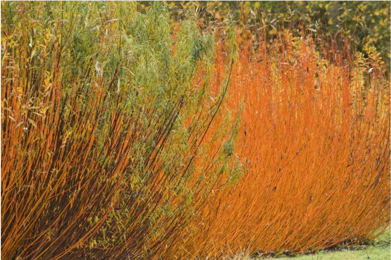
© N. VAN INGEN - culture de l'osier

L'osier est ensuite séché quelques heures au soleil, puis stocké dans des greniers, à l'abri de la lumière, jusqu'à utilisation. Avant de tresser, le vannier place ses brins dans l'eau pour que le matériau soit souple et facile à manier.