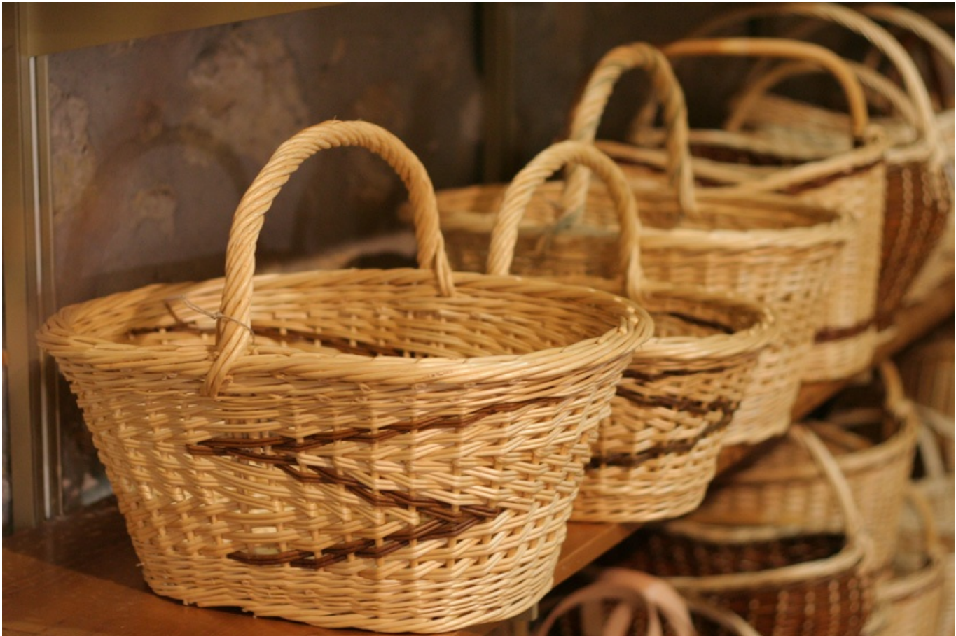
paniers de la coopérative de Villaines-les-Rochers

Que vous soyez amateur d'objets artisanaux ou simple curieux, n'hésitez pas à pousser la porte du magasin d'exposition de la coopérative. On y trouve un musée de l'osier ainsi qu'une partie boutique, où chaque produit est fabriqué à la main dans la plus pure tradition.