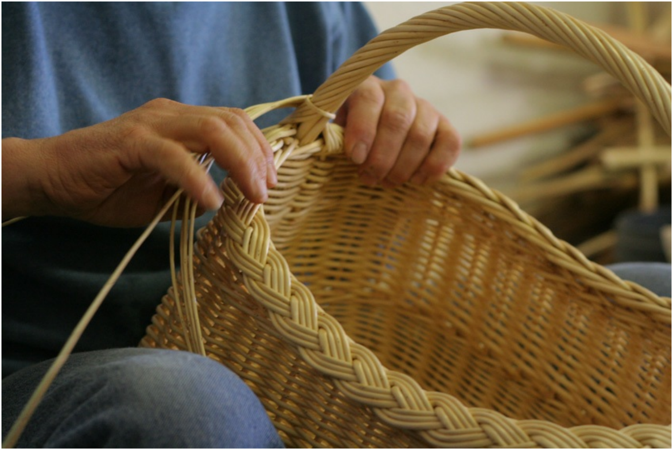
© J. TROLONG - vannier tressant un panier

Aujourd'hui, un vannier qui souhaite vivre de son art doit être polyvalent et savoir innover pour suivre les évolutions de la mode. Les objets en osier reviennent au goût du jour, dans la veine de l'engouement pour l'artisanat, le « naturel » et le « fait main ».