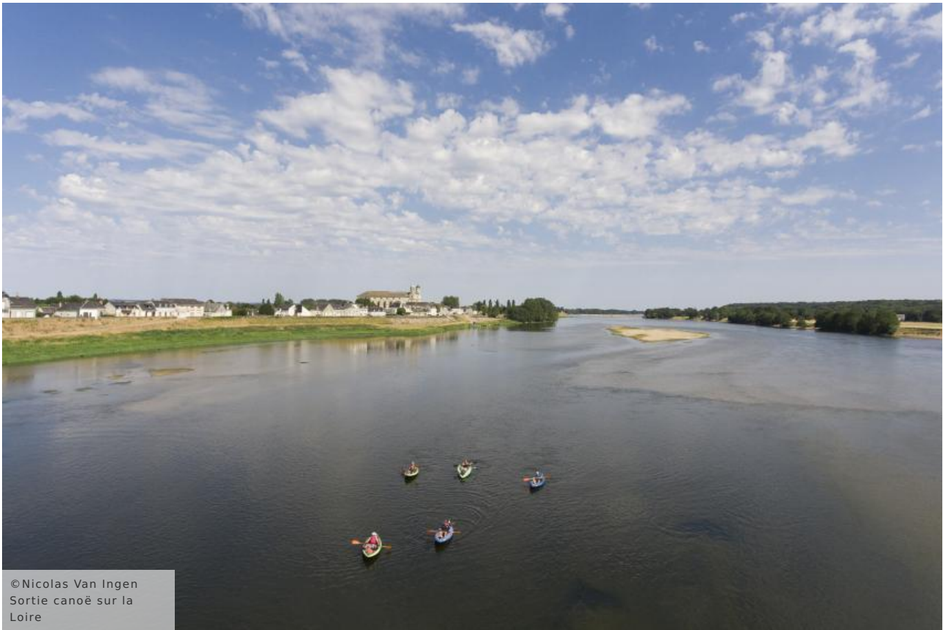
Sortie canoë sur la Loire