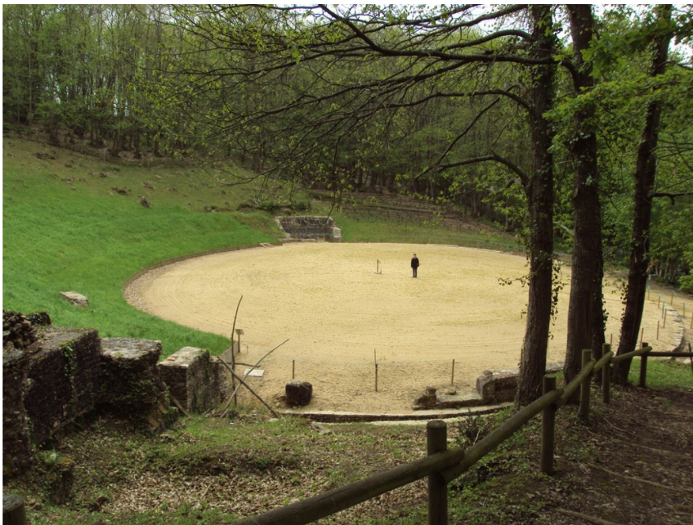
théâtre gallo-romain de Gennes

À proximité, Gennes accueille un autre site archéologique majeur. On y trouve quelques-uns des plus beaux vestiges de la région : le plus connu est le théâtre gallo-romain de Mazerolles, redécouvert au début du 19 e siècle. De forme elliptique, il est adossé au coteau et pouvait accueillir environ 5 000 spectateurs. C'est l'un des plus grands théâtres antiques de l'Ouest de la France ! En souterrain, un aqueduc alimentait en eau les thermes de Gennes, à l'emplacement de l'église Saint-Vétérin, ainsi qu'un sanctuaire dédié aux divinités des eaux, le nymphée de Mardron. Un autre temple était probablement consacré à Mercure, où se dresse aujourd'hui l'église Saint-Eusèbe.