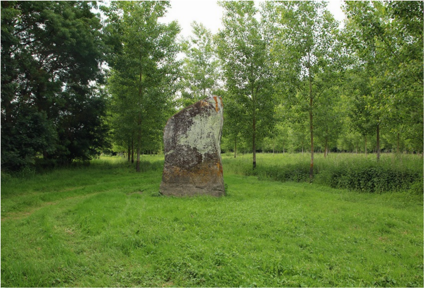
menhir situé à Artannes-sur-Thouet