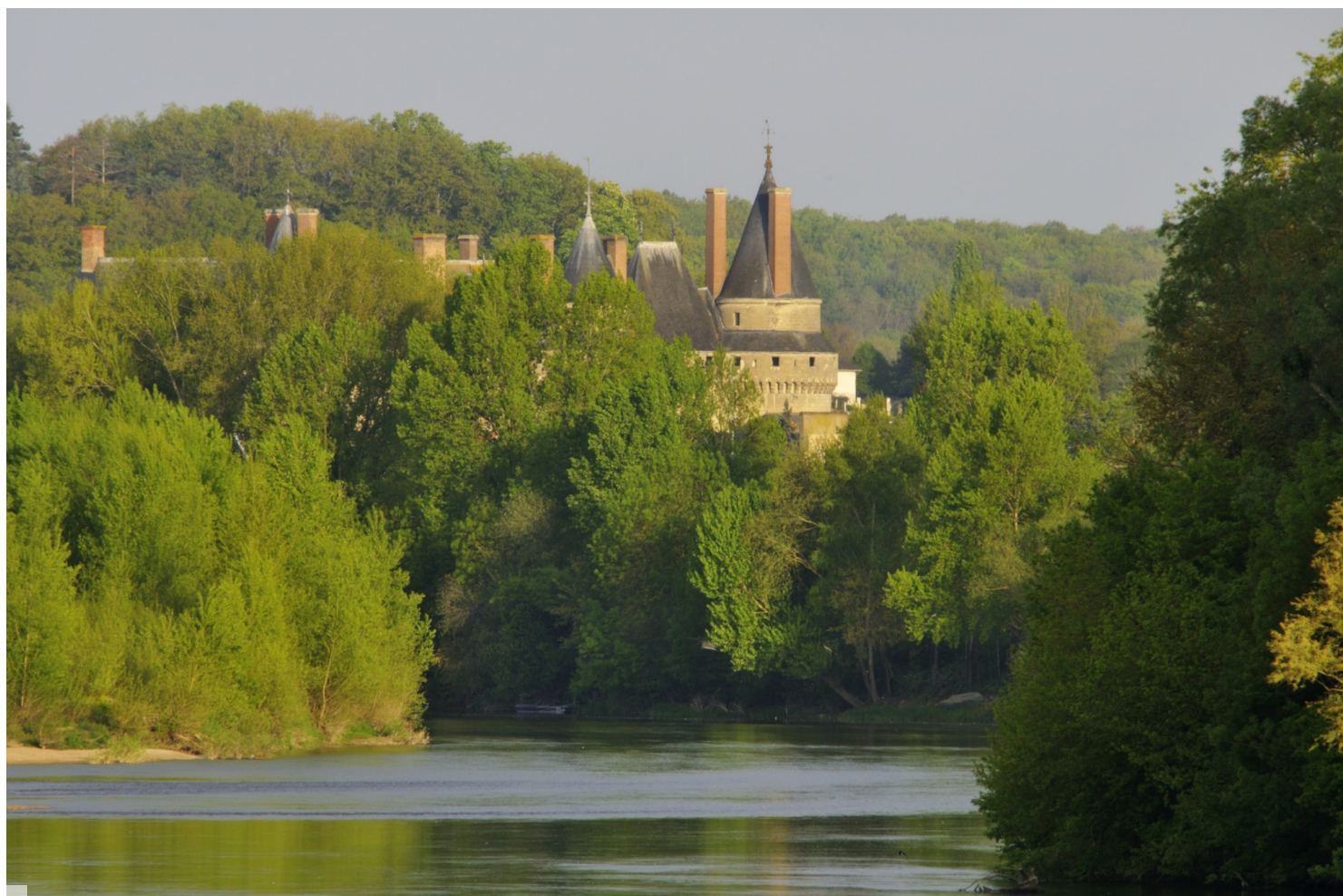
Château de Langeais

Construits à moins d'un siècle d'écart, les donjons de Doué-la-Fontaine et de Langeais illustrent de façon exceptionnelle l'apparition de l'architecture fortifiée en France.