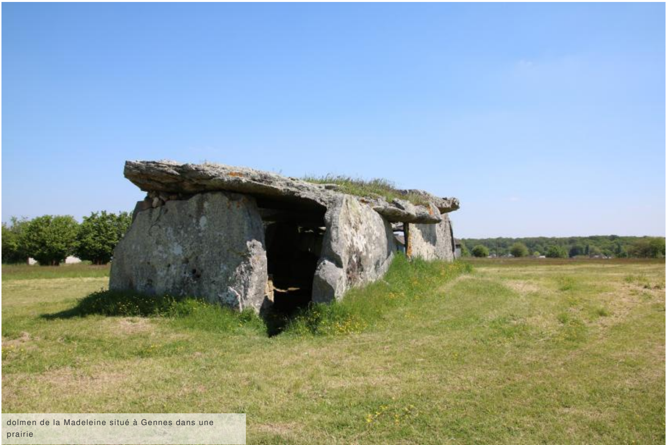
dolmen de la Madeleine situé à Gennes dans une prairie