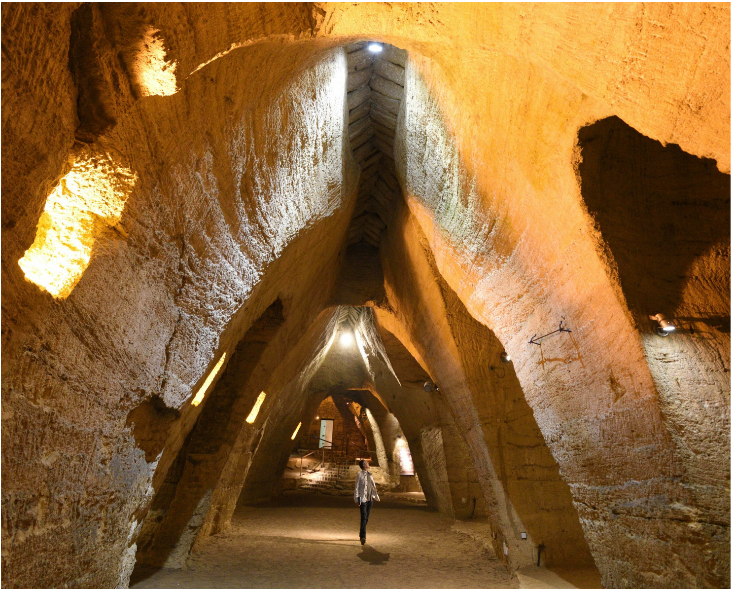
Troglodyte de falun, caves cathédrales à Doué-la-Fontaine (49)