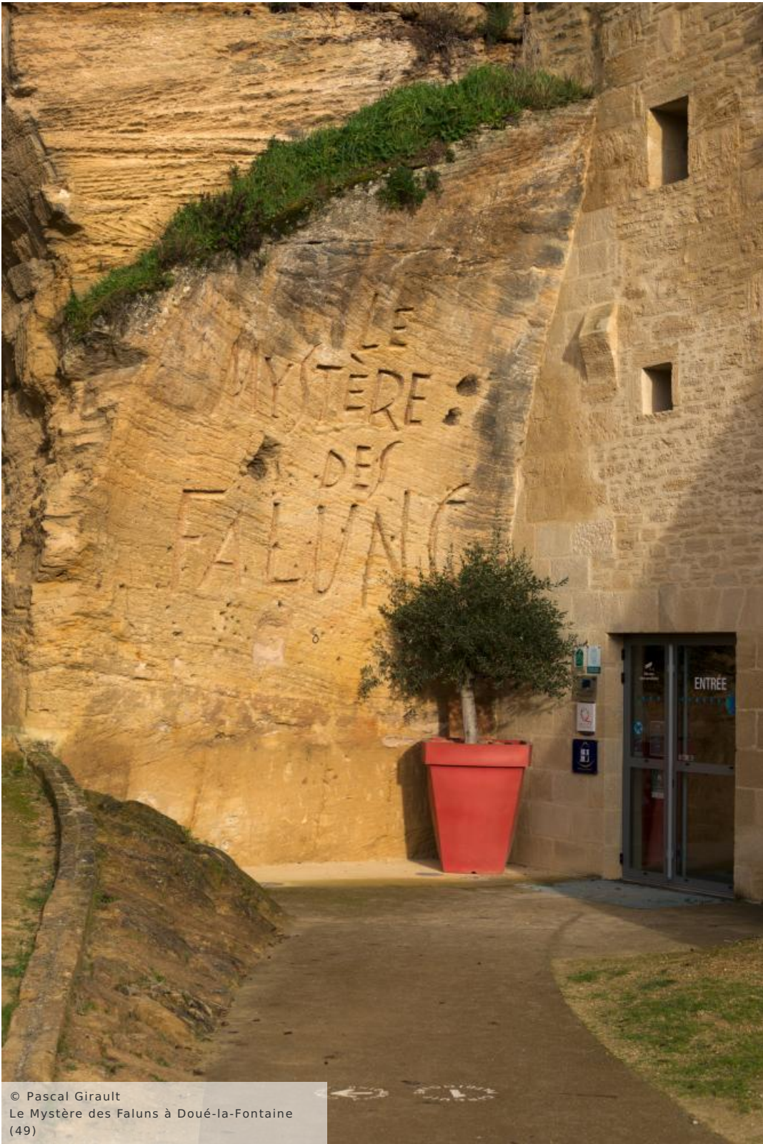
Le Mystère des Faluns à Doué-la-Fontaine (49)