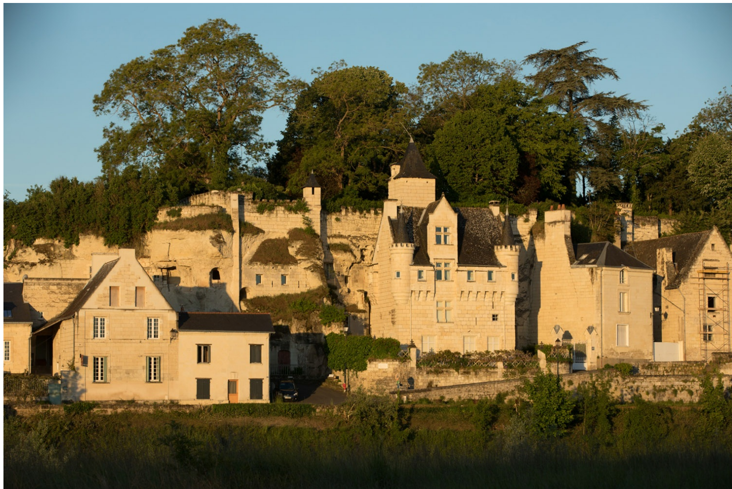
Front bâti de Souzay (49)

À Chinon , le dernier coteau habité est évacué au début des années 1980. Par mesure de sécurité, les habitats souterrains sont démolis ou murés, mais on peut encore y admirer la chapelle troglodytique de Sainte-Radegonde. Non loin de là, à Azay-le-Rideau , la vallée troglodytique des Goupillières offre une immersion dans le quotidien des paysans du XIXe siècle. Levillage troglodytique de Villaines-les-Rochers a également su tirer profit des qualités de cet habitat pour devenir la capitale de la vannerie.