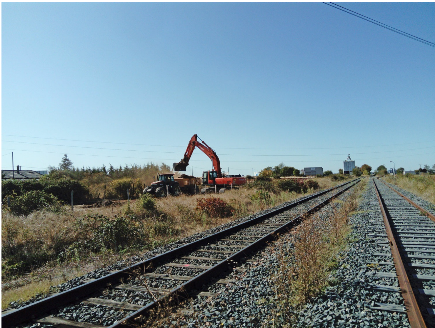
Mise en œuvre de la compensation écologique d'une entreprise à Méron, ici récréation de pelouses sèches patrimoniales (septembre 2019).