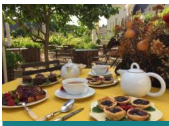
La Table des Fées