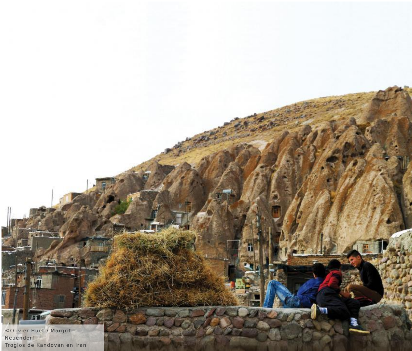
Troglodytes de Kandovan en Iran