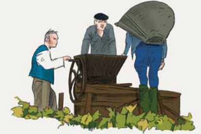
2 Les vendanges