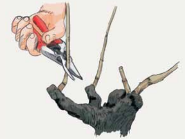
4 La taille